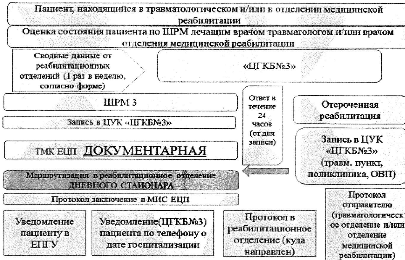
СХЕМА РАБОТЫ Бюро маршрутизации по сбору информации о пациентах, нуждающихся в переводе на 3 этап медицинской реабилитации (в условиях дневного стационара)

Приложение № 2 к Положению об организации направления на медицинскую реабилитацию пациентов с заболеваниями периферической нервной системы и костно-мышечной системы с применением телемедицинских технологий в Бюро маршрутизации ГАУЗ СО «ЦГКБ № 3»