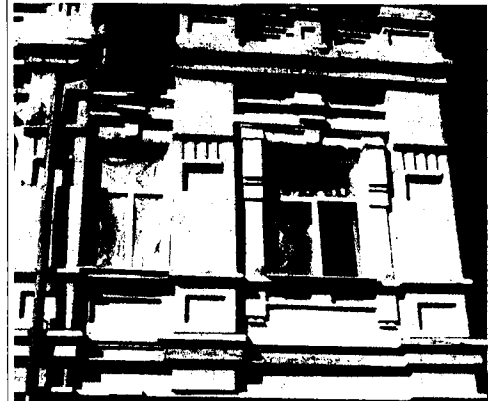
Фото правой части главного фасада с угловым аттиком