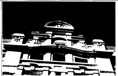
Фото центрального аттика