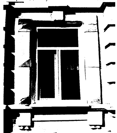
Фото рядового оконного проема с наличником