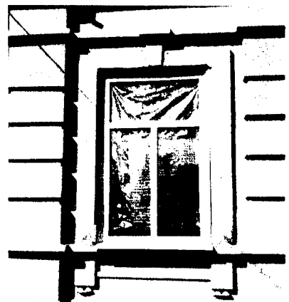
Фото углового оконного проема с наличником