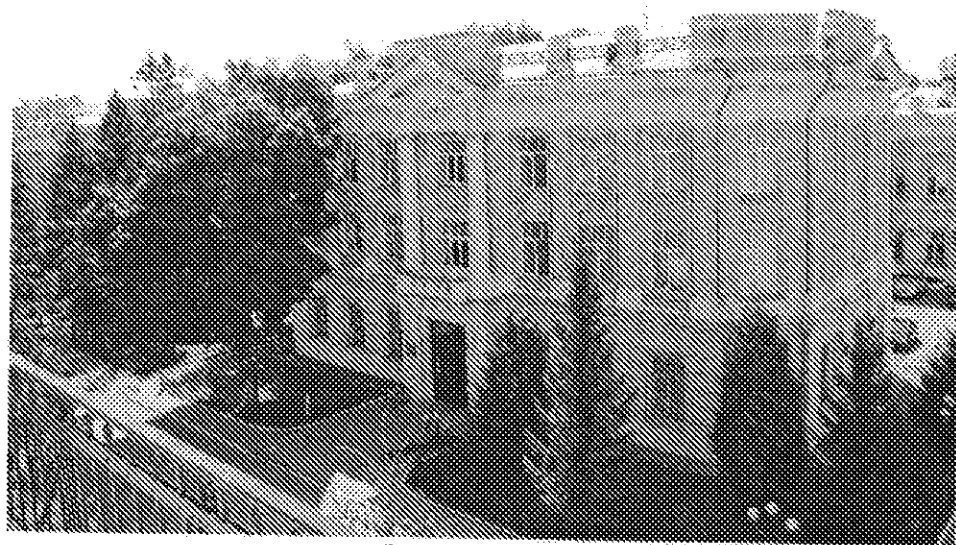
учебный корпус № 4.