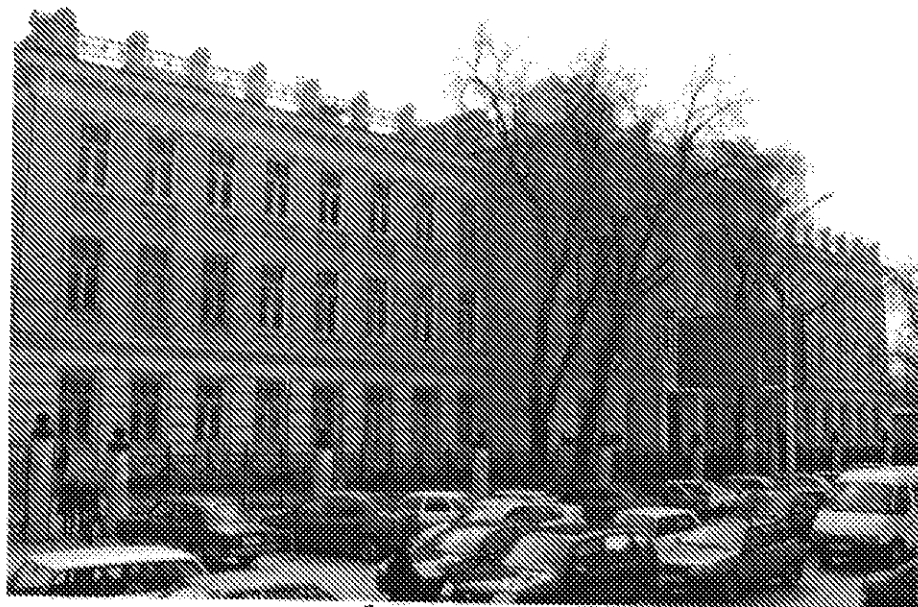
учебный корпус № 3.