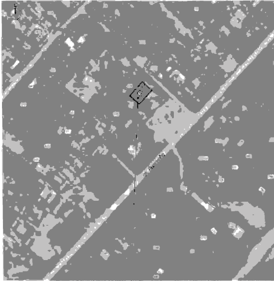
Объект культурного наследия регионального значения Здание бывшего начального народного училища Шигонский район, с. Устье