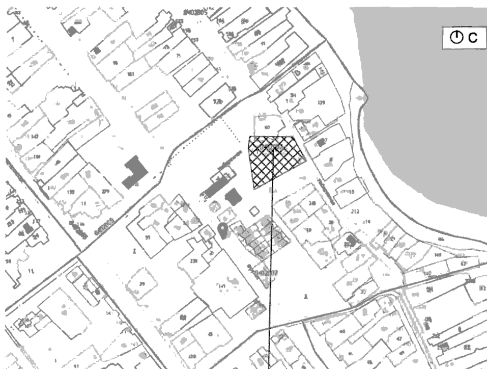
Границы объекта культурного наследия регионального значения "Троицкая церковь"