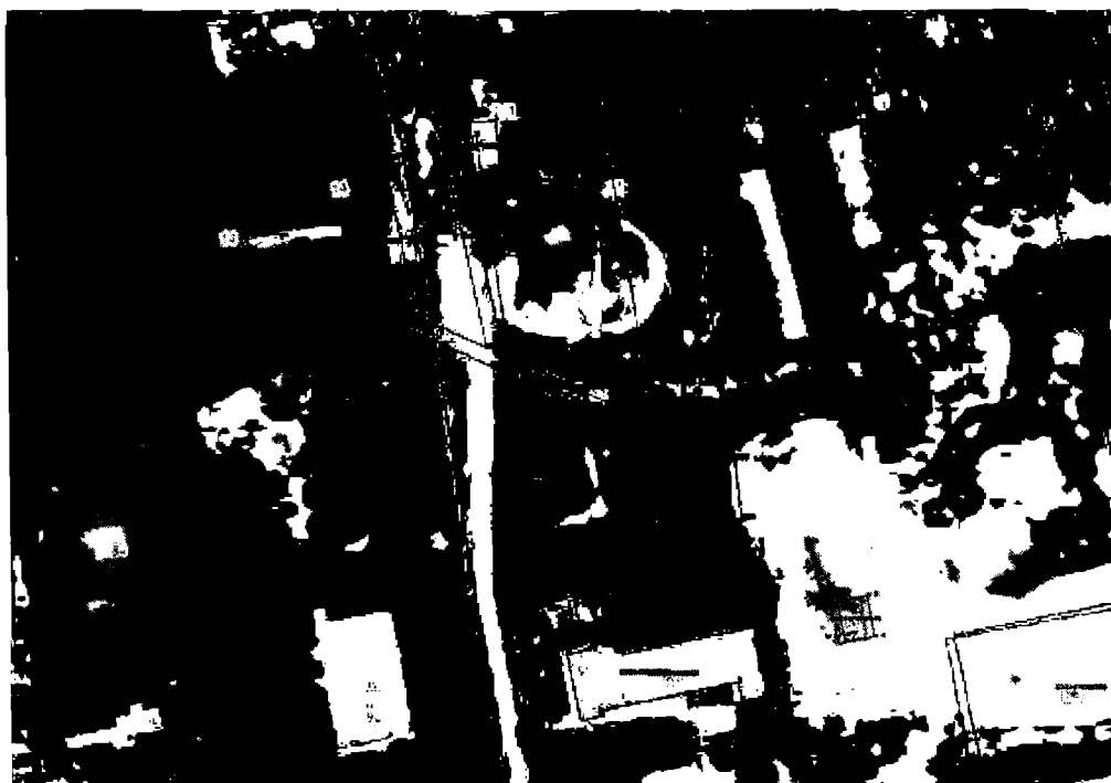
Схема границ территории объекта культурного наследия