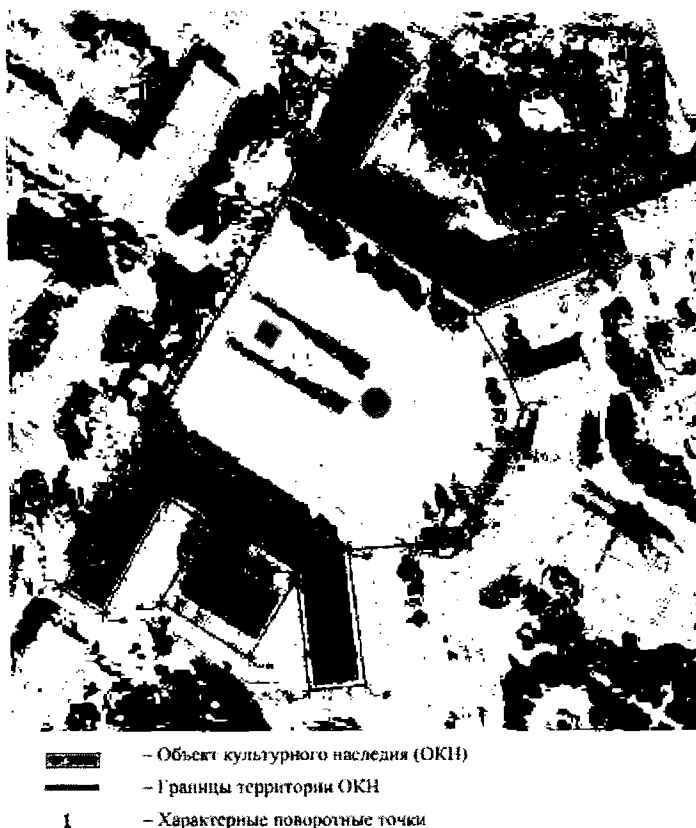
Схема границ территории объекта культурного наследия