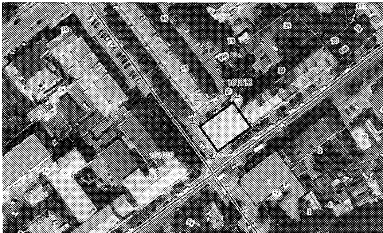
Схема границ территории объекта культурного наследия