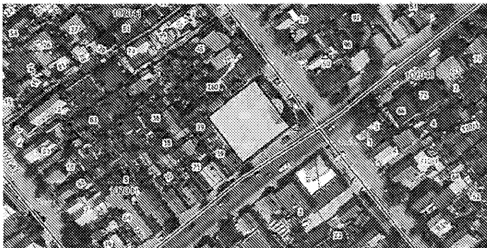
Схема границ территории объекта культурного наследия