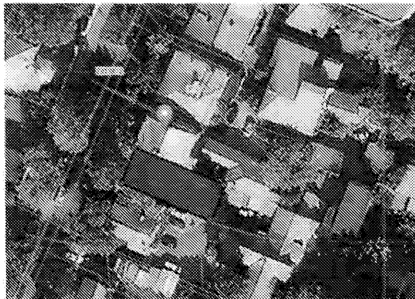
Схема границ территории объекта культурного наследия