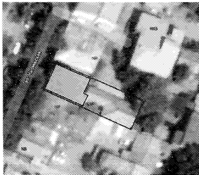
Схема границ территории объекта культурного наследия