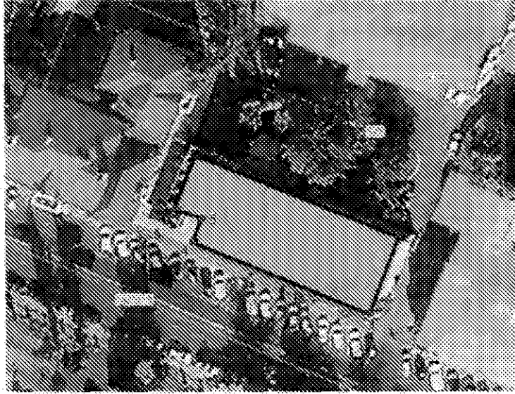
Схема границ территории объекта культурного наследия