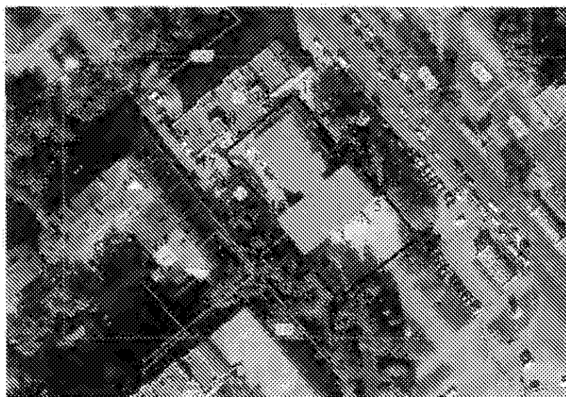
Схема границ территории объекта культурного наследия