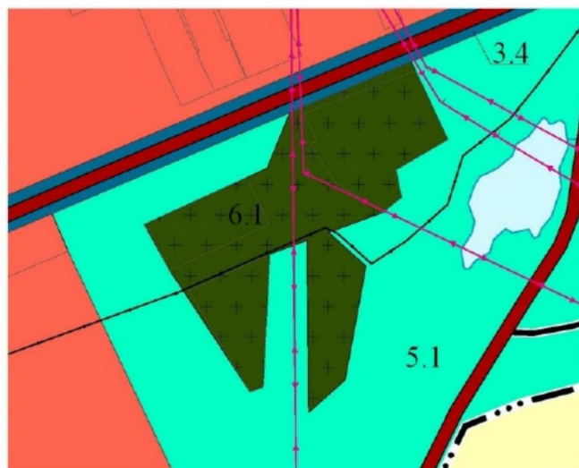
Фрагмент карты функциональных зон поселения М 1:5000