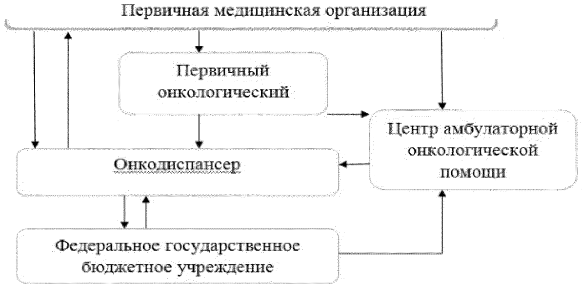
Рисунок № 1. Трехуровневая система оказания медицинской помощи пациентам с онкологическими заболеваниями

В Ростовской области медицинская помощь пациентам с онкологическими заболеваниями оказывается в рамках трехуровневой системы (рисунок № 1).