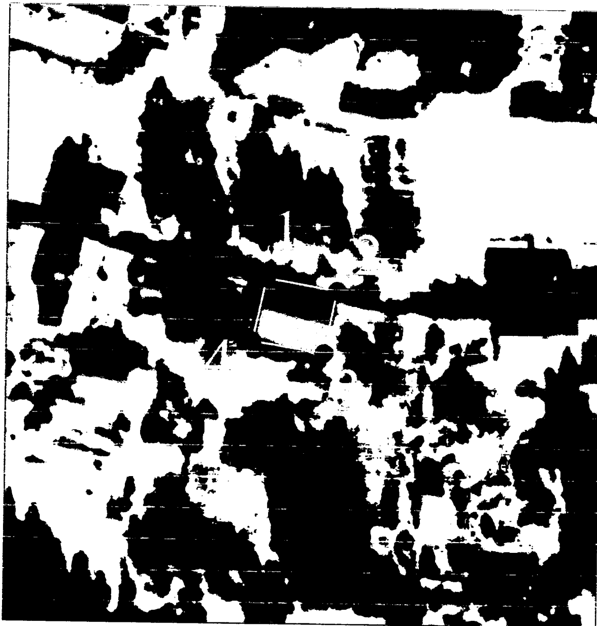
Схема границ территории объекта культурного наследия регионального значения «Дом жилой», начало XX в., расположенного по адресу: Псковская область, Опочецкий район, город Опочка, улица Дзержинского, 71