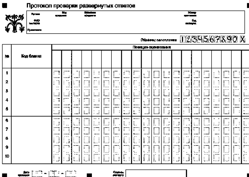
Рис. 1. Протокол проверки развернутых ответов

При оценивании ЭР участников ГВЭ эксперт ПК результаты оценивания выполнения каждого задания с кратким ответом, с развернутым ответом, а также полученный участником ГВЭ первичный балл вносит в Форму проверки работ ГВЭ.