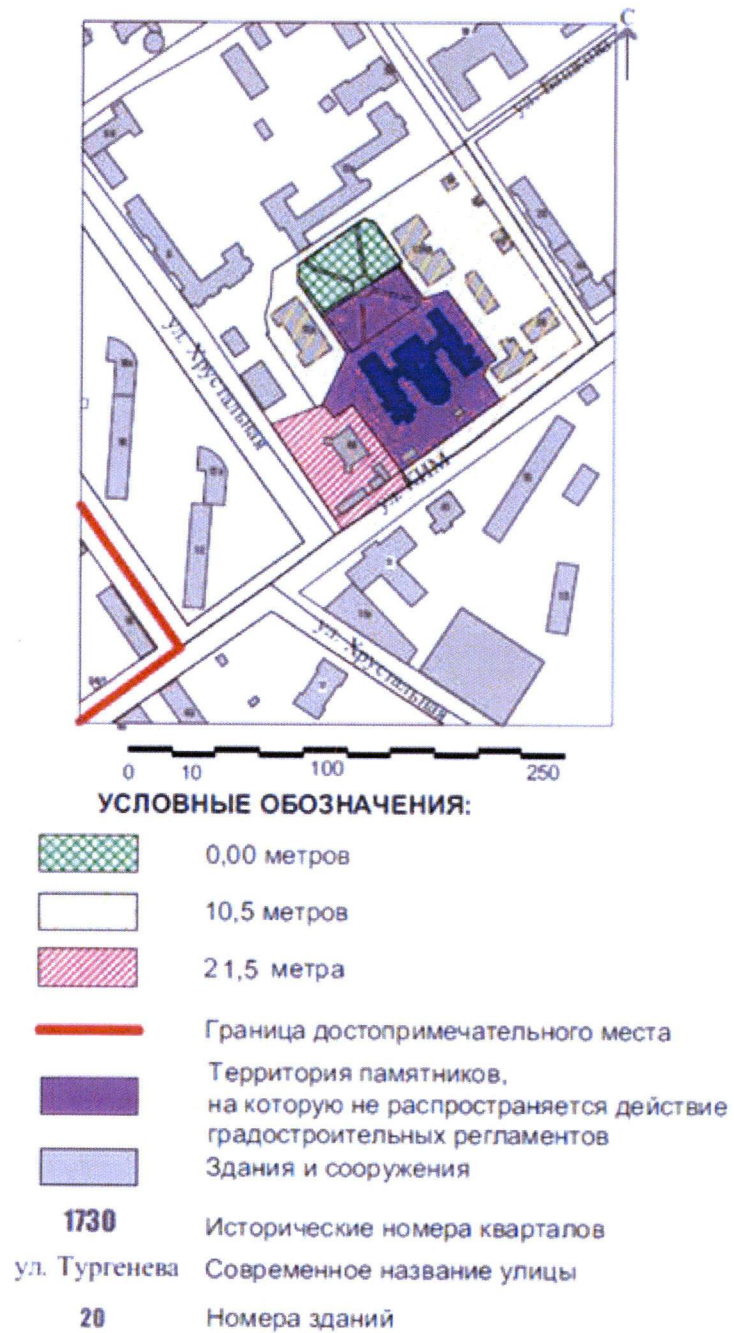
Схема 2. Предельная высота объектов капитального строительства