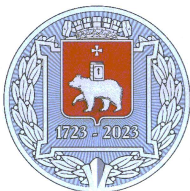
РИСУНОК И ОПИСАНИЕ юбилейного памятного знака «Трудовому коллективу за вклад в развитие Перми»

УТВЕРЖДЕНЫ указом губернатора Пермского края от 11.02.2022 № 16