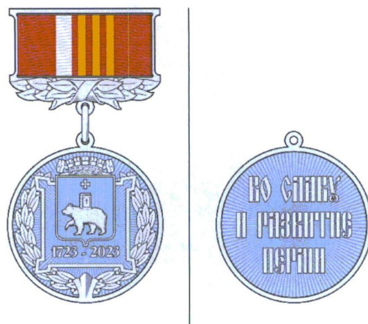
РИСУНОК И ОПИСАНИЕ юбилейной медали «Во славу и развитие Перми»

Юбилейная медаль «Во славу и развитие Перми» изготавливается из серебристого металла и имеет форму круга диаметром 29 мм с выпуклым бортиком. На лицевой стороне по центру помещены рельефные изображения лежащей на лавровом венке видимой сверху квадратной крепости с малыми бастionsами на ее углах, поверх верхнего края которой помещен герб Перми с короной города трудовой славы и доблести, сопровождаемый внизу датами «1723 – 2023». Поверхность гербового щита покрыта вертикальными выпуклыми линиями. Нижняя часть венка в месте соединения ветвей перекрыта отходящей от бортика фигурой, напоминающей лилию. На оборотной стороне по центру рельефная надпись стилизованными старославянскими буквами в три строки «ВО СЛАВУ / И РАЗВИТИЕ / ПЕРМИ». Участки обеих сторон, не занятые названными изображениями, имеют рельеф в виде лучей, расходящихся из центра. Подвеска при помощи ушка и кольца соединяется с металлической колодкой, представляющей собой прямоугольную пластину высотой 27,5 мм и шириной 18,5 мм, с рамками в верхней и нижней частях и положенной вдоль нижнего края рельефного изображения перевязанной лентой гирлянды из лавровых ветвей. Вдоль рамок идут прорезы, внутренняя часть колодки обтянута муаровой лентой красного цвета с четырьмя полосками по центру: белой шириной 2 мм и тремя желтыми шириной 1,5 мм каждая, с просветами в 1 мм между ними. Колодка имеет на оборотной стороне крепление для ношения на одежде.