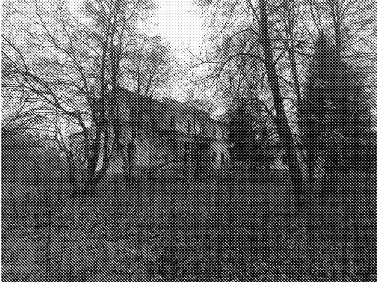
Вид на фасад объекта культурного наследия