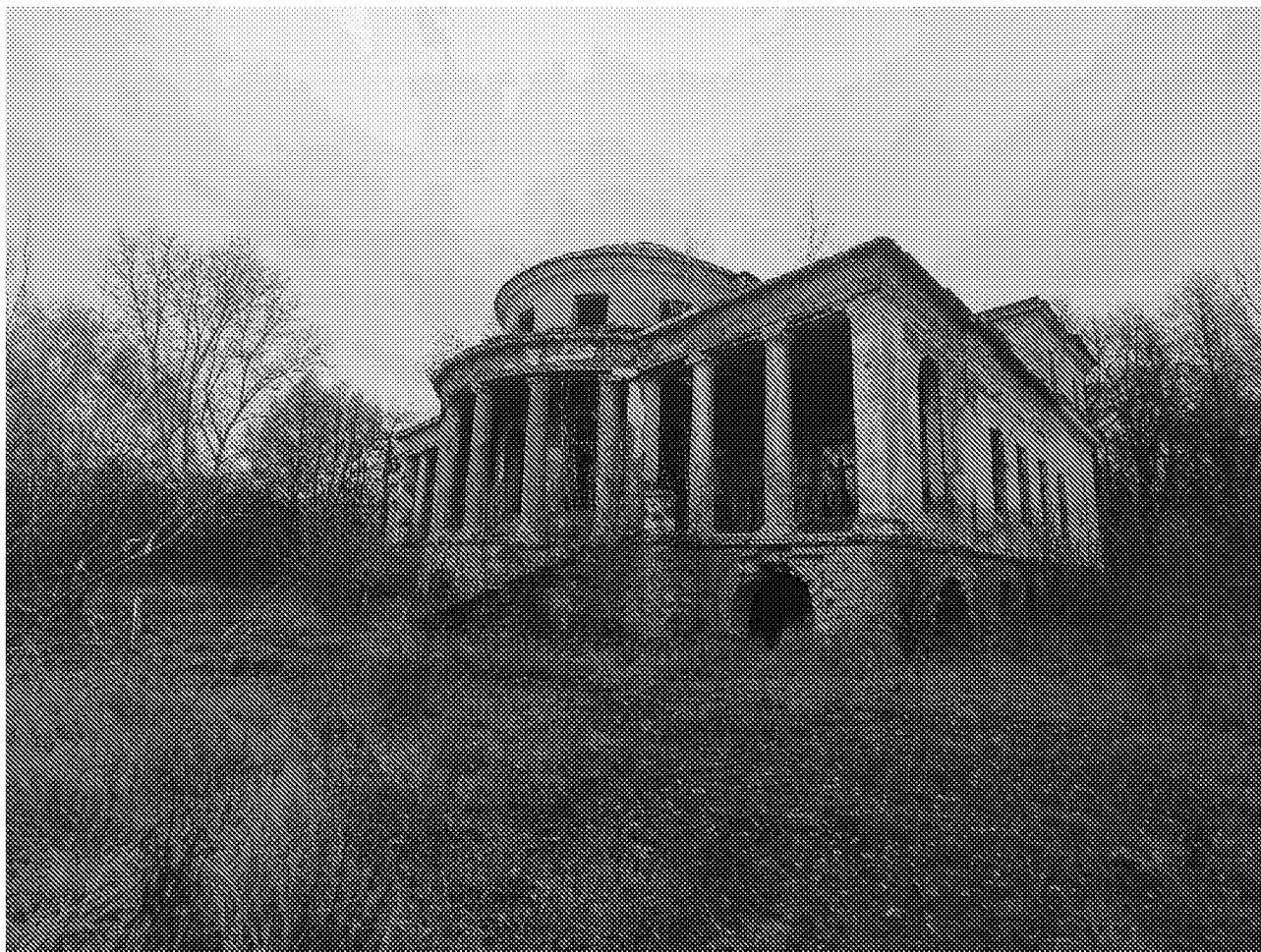
Вид на главный фасад объекта культурного наследия