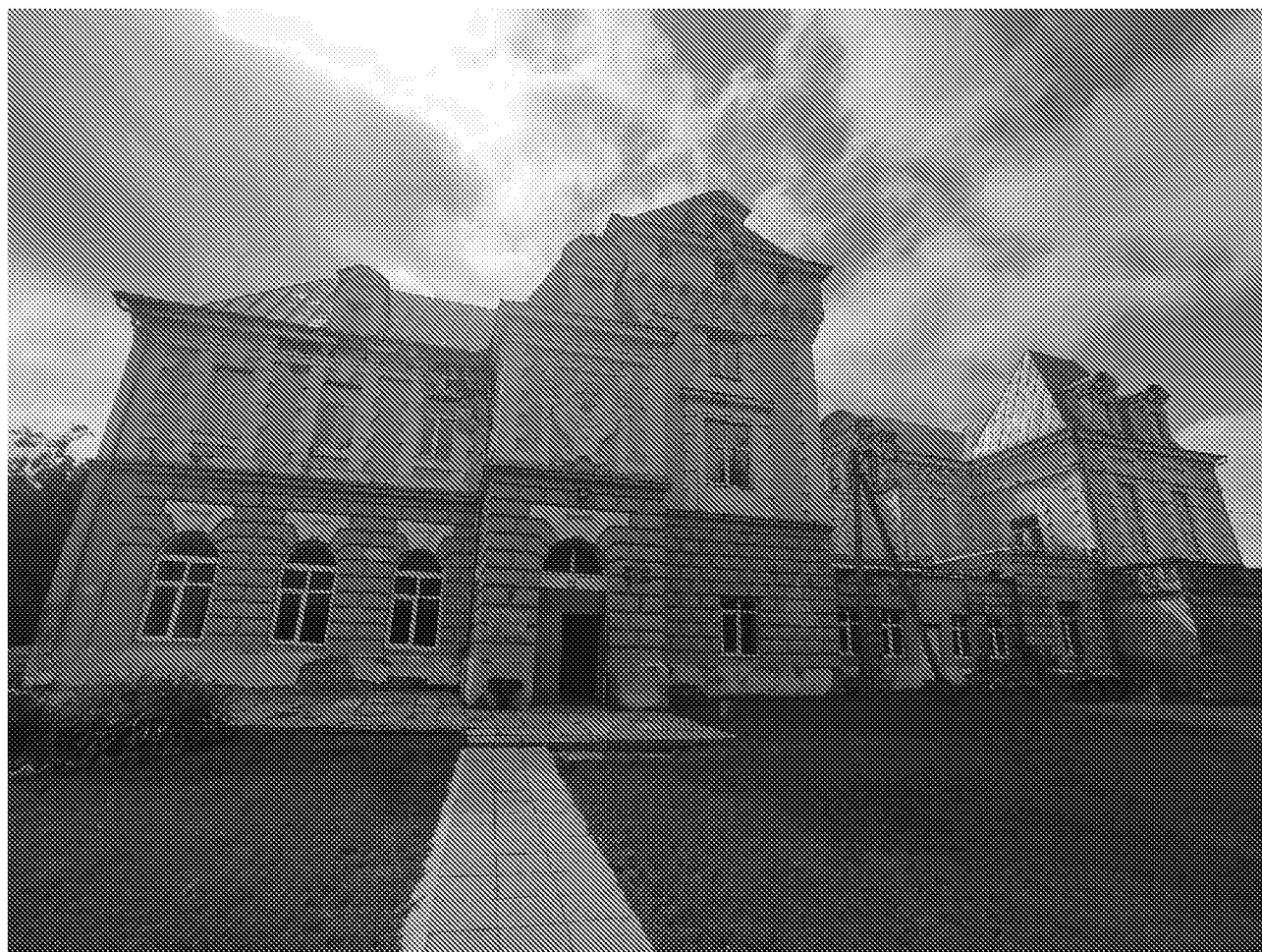
Вид на главный фасад объекта культурного наследия