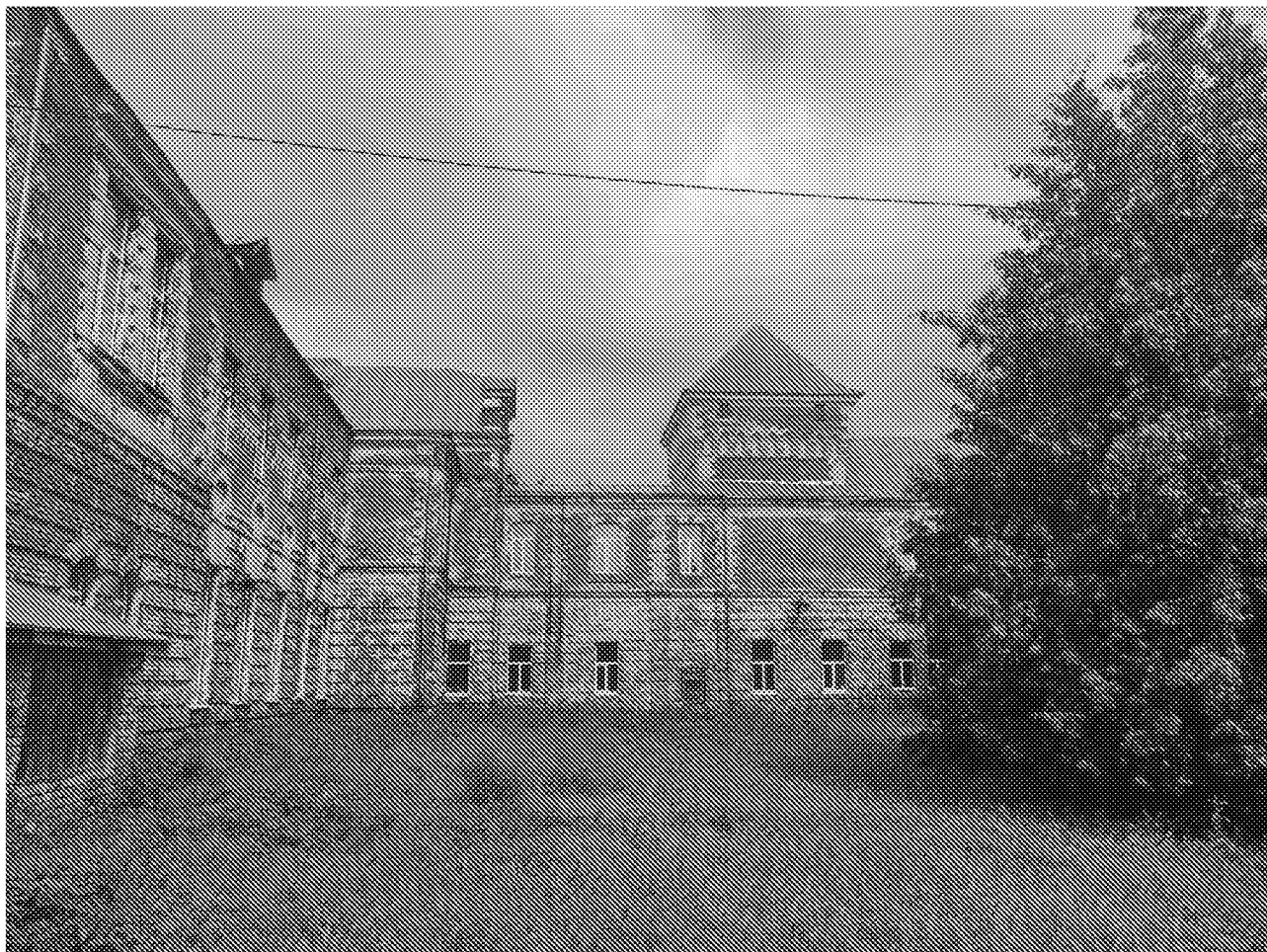
Фрагмент южного фасада объекта культурного наследия