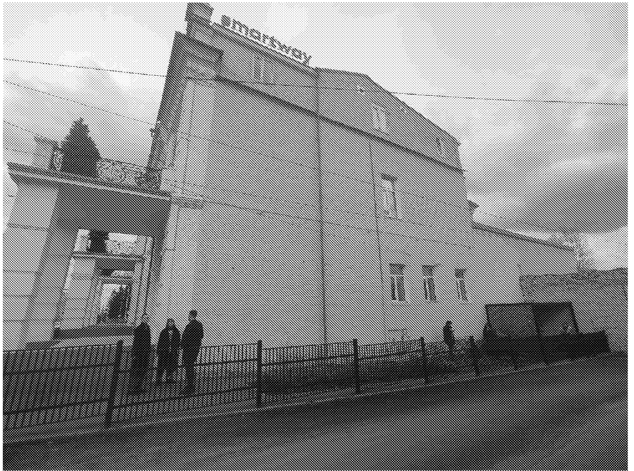
Фрагмент южного фасада объекта культурного наследия