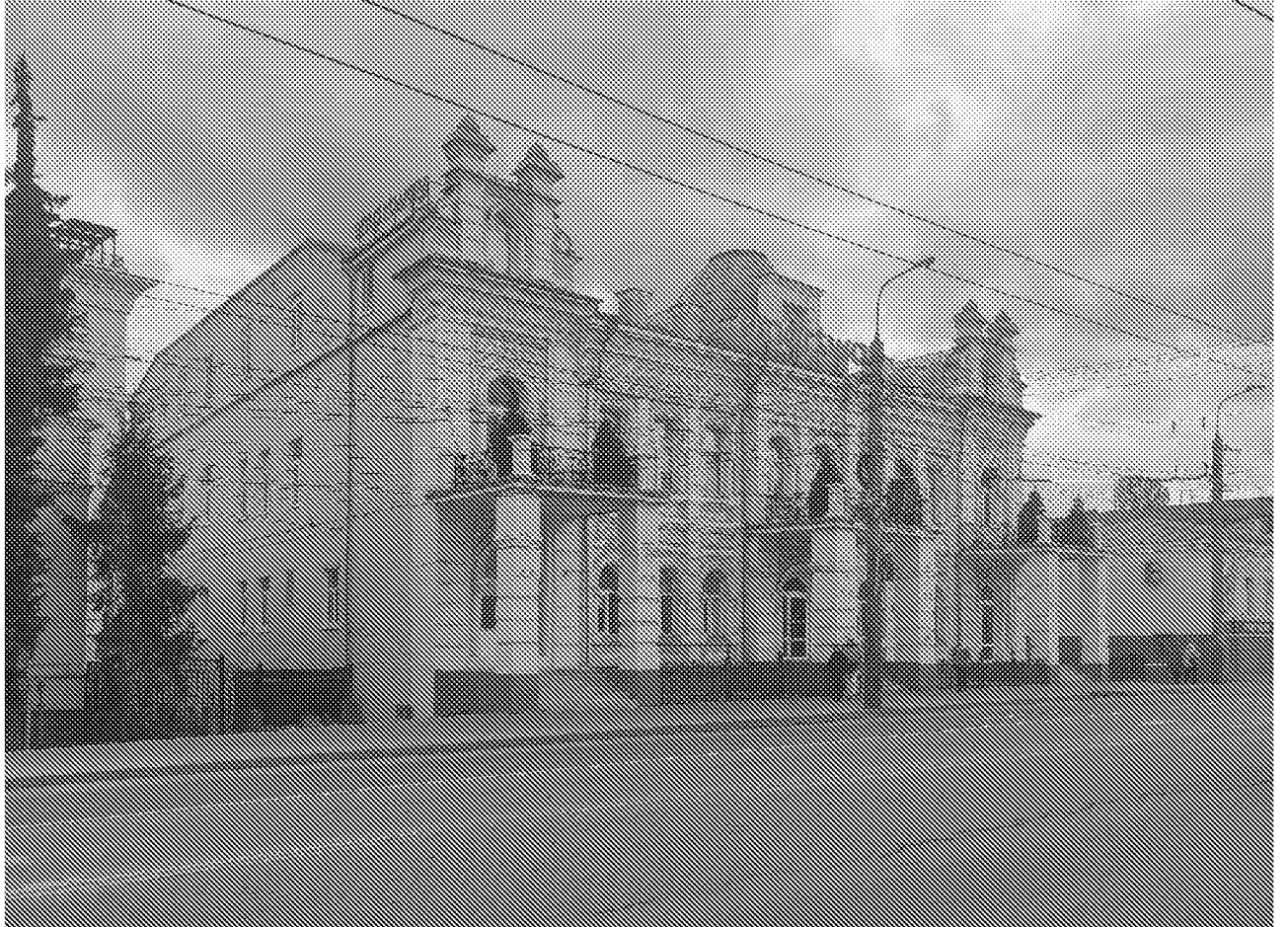
Вид на главный фасад объекта культурного наследия