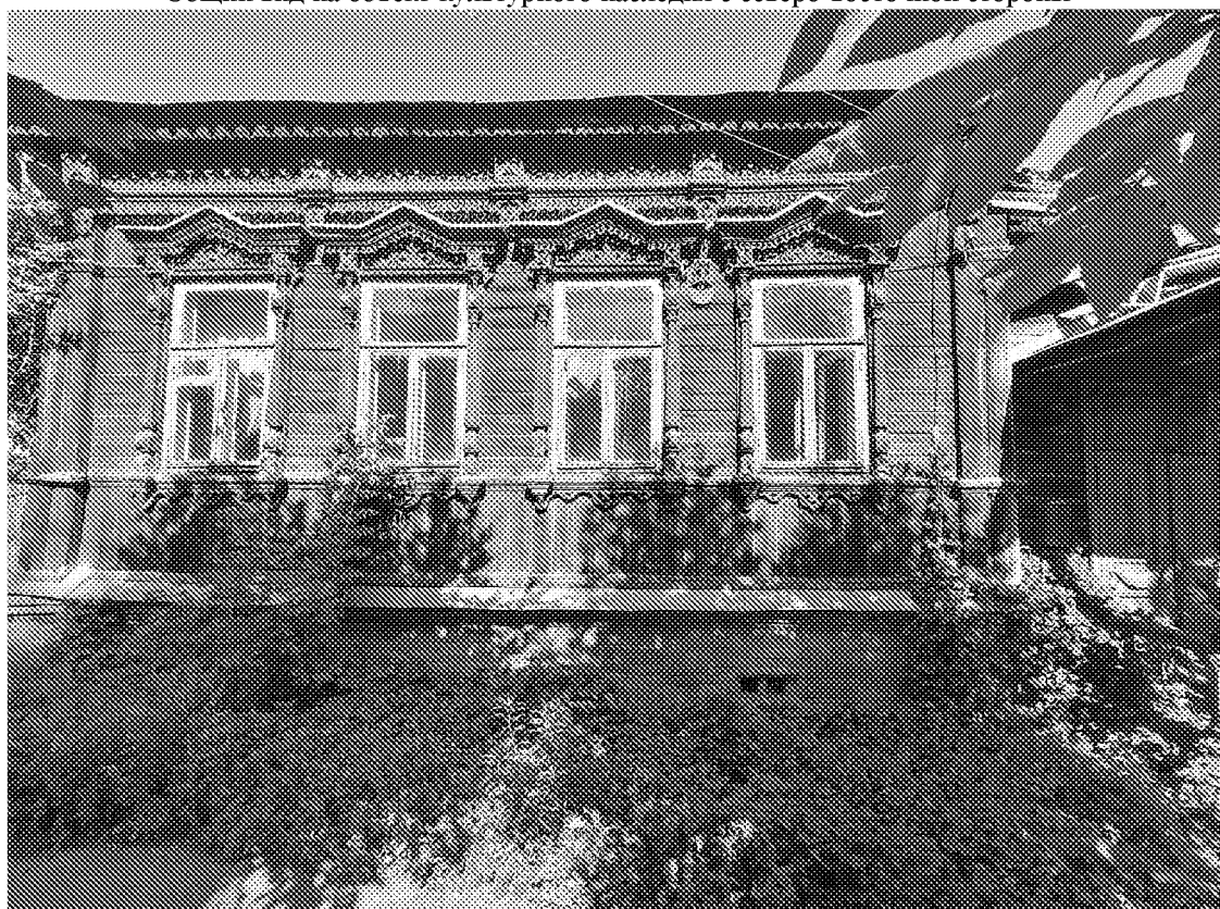
Декор главного фасада объекта культурного наследия