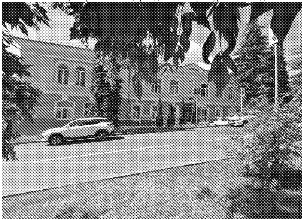
Северный фасад объекта культурного наследия