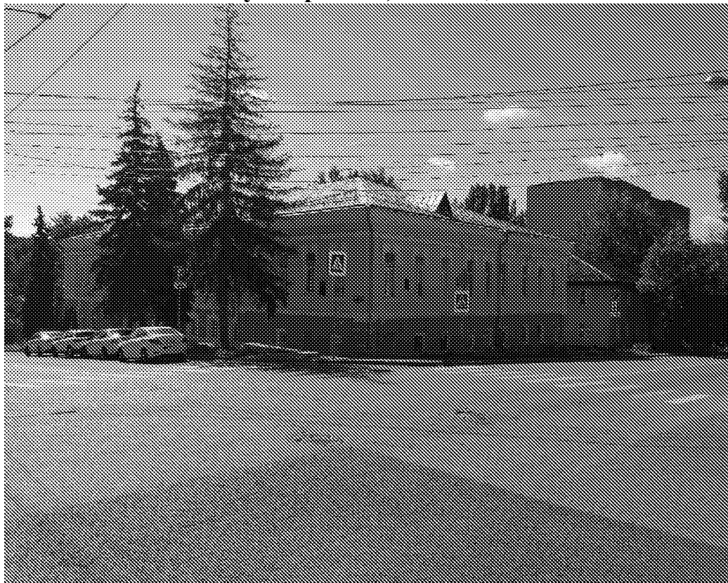
Главный (северо-западный) фасад объекта культурного наследия

Фотографическое изображение объекта культурного наследия «Здание бывш. духовного училища (ныне – проектная контора «Облкоммунпроект»), где учились русский историк академик В.О. Ключевский, пролетарский поэт А.А. Богданов, первый президент Академии медицинских наук СССР Н.Н. Бурденко, ряд других деятелей науки и искусства» (Пензенская область, г. Пенза, ул. Чкалова/ ул. Красная, д. 56/31)