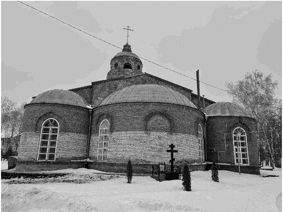
Восточный фасад (апсида) объекта культурного наследия