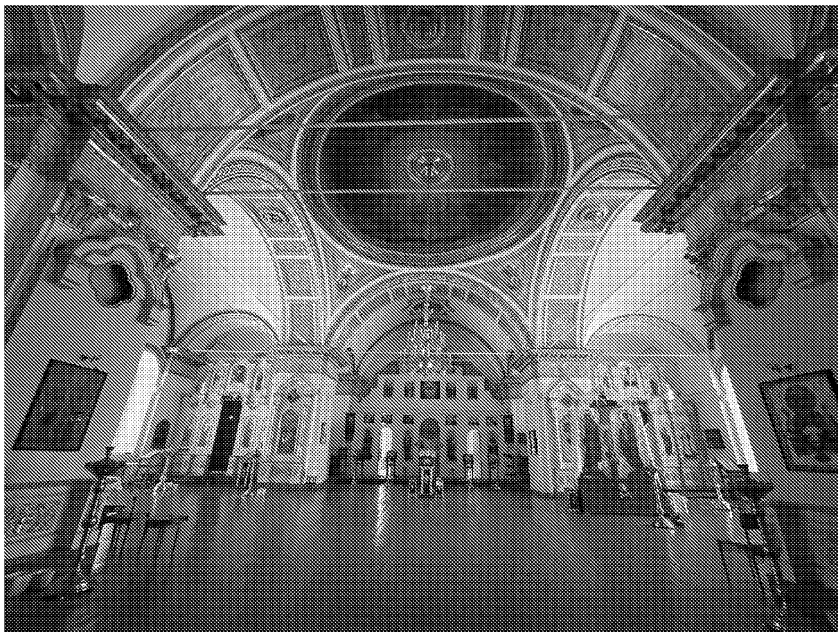
Интерьер объекта культурного наследия. Центральный иконостас