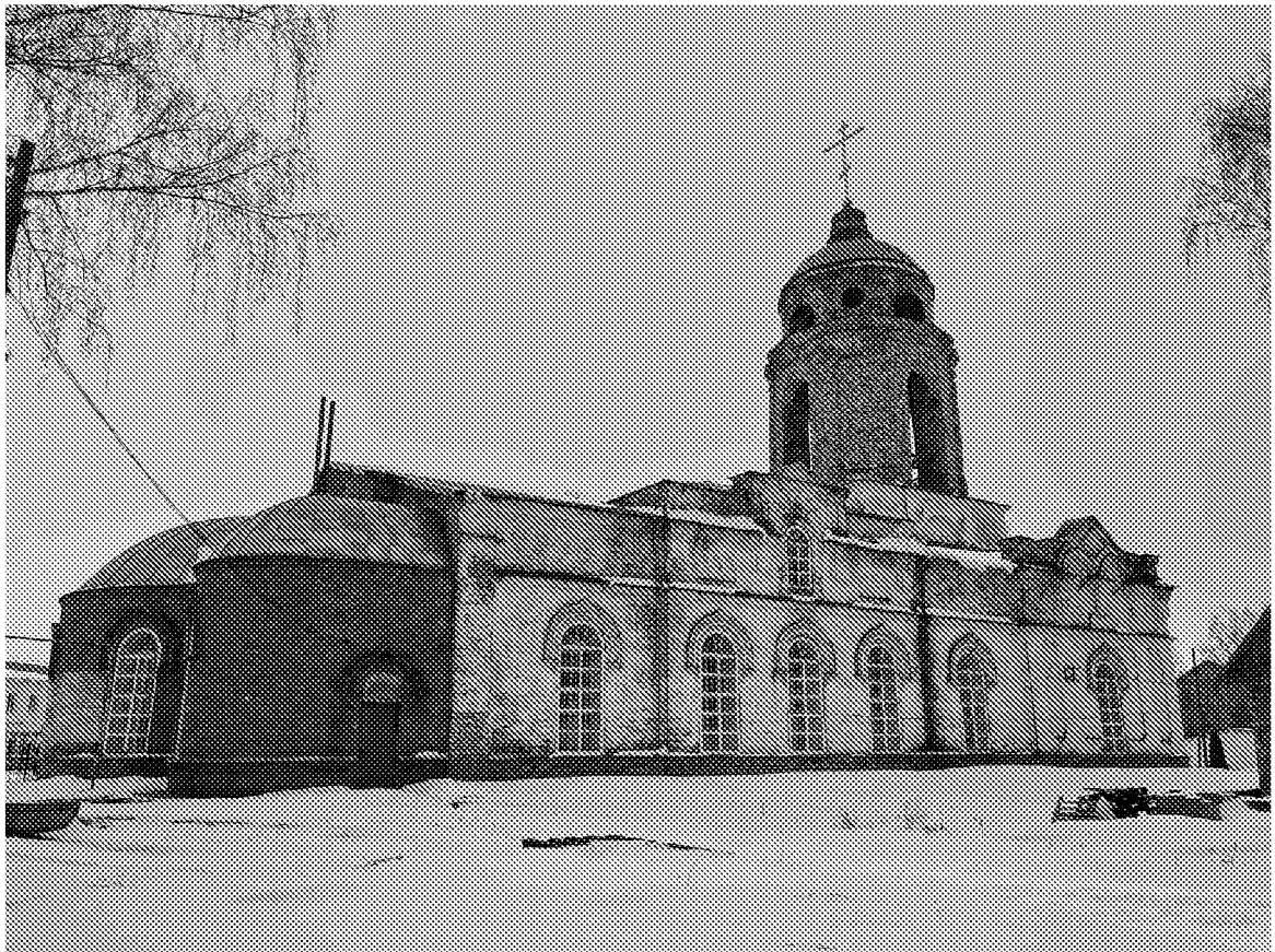
Южный фасад объекта культурного наследия