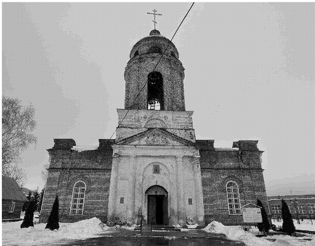
Западный фасад объекта культурного наследия