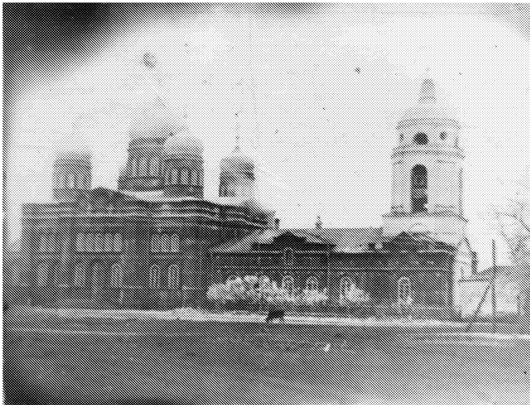
Историческая фотофиксация объекта культурного наследия