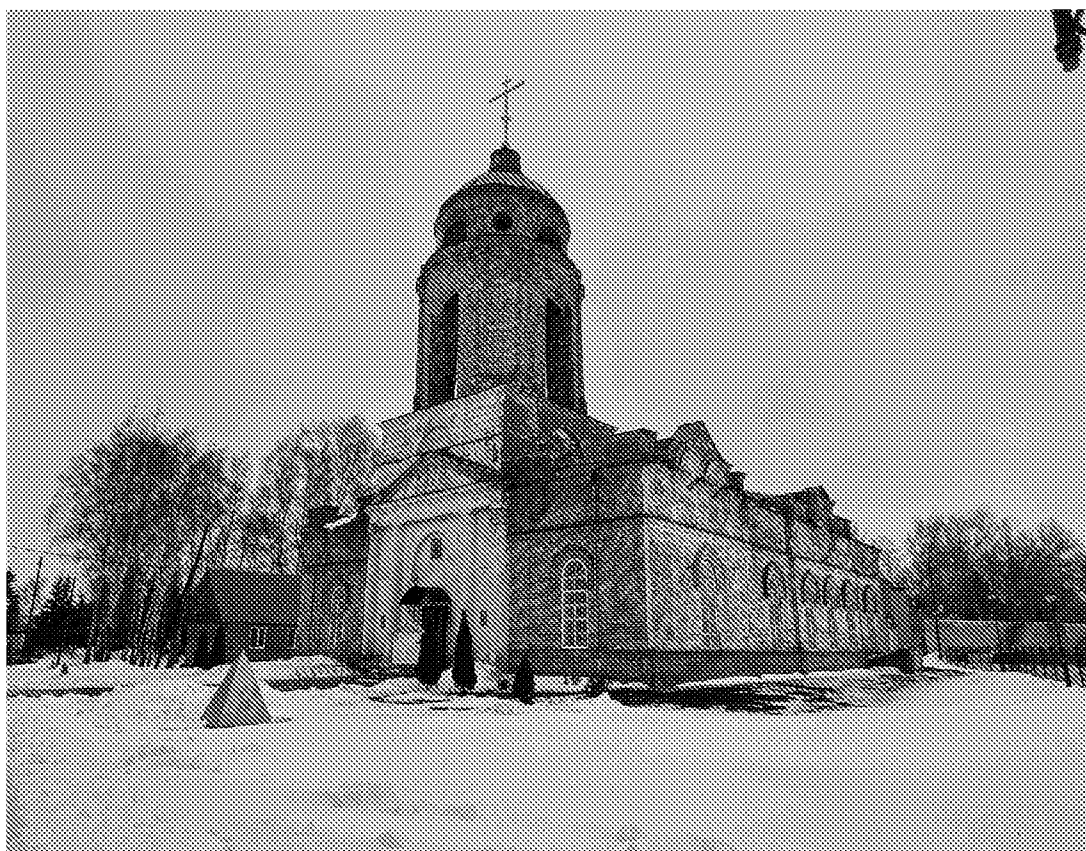
Юго-западный фасад объекта культурного наследия