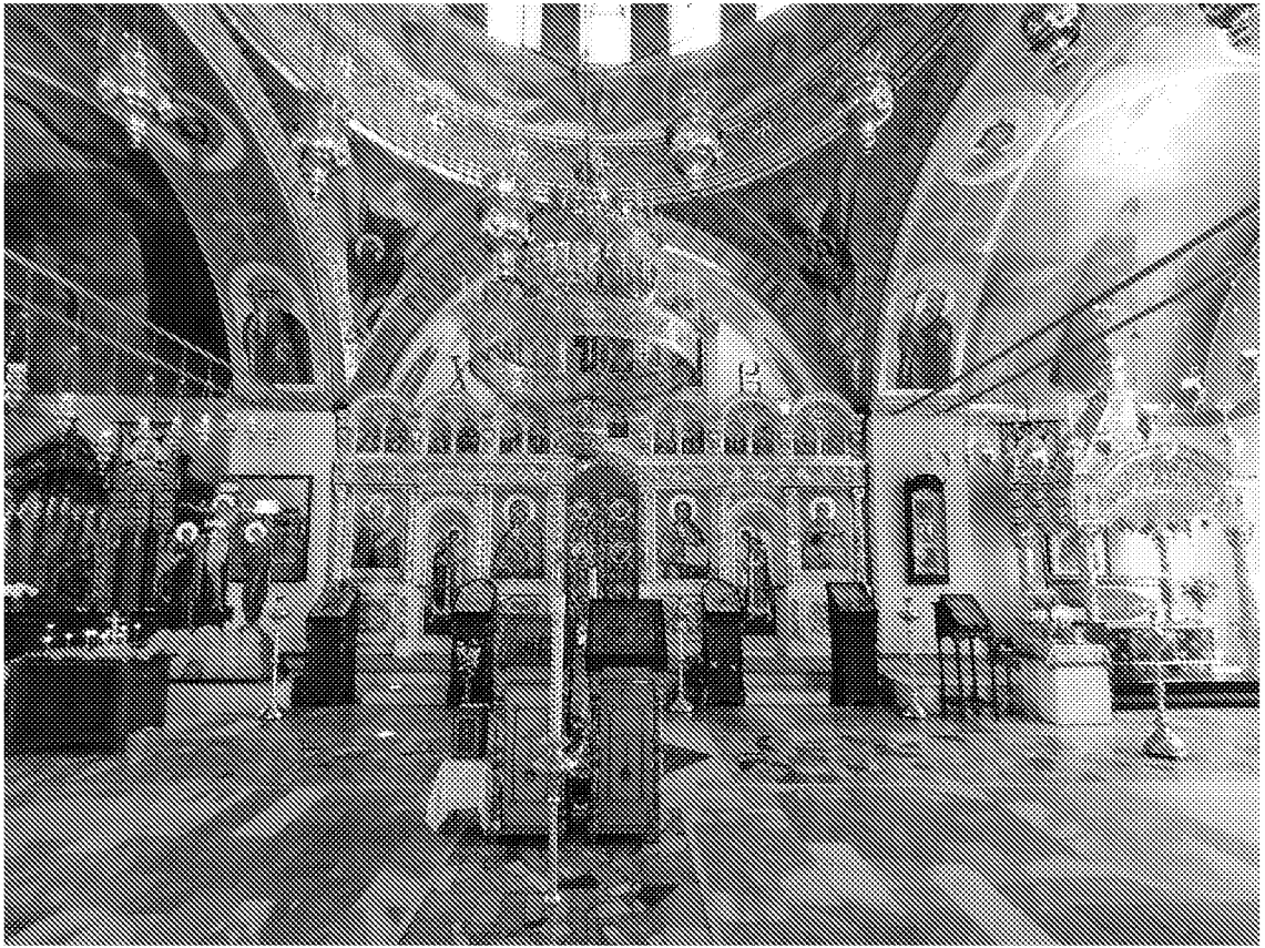
Интерьер объекта культурного наследия