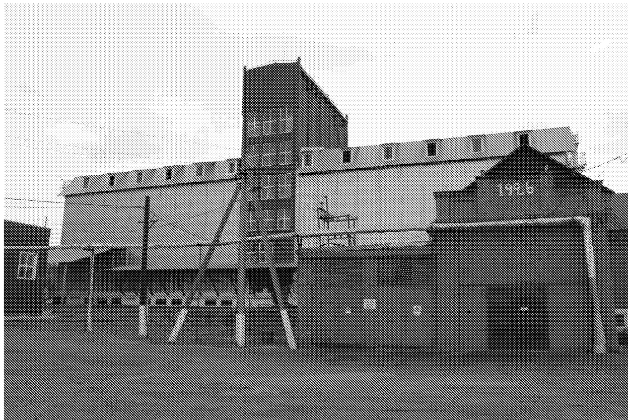
Центральный фасад объекта культурного наследия