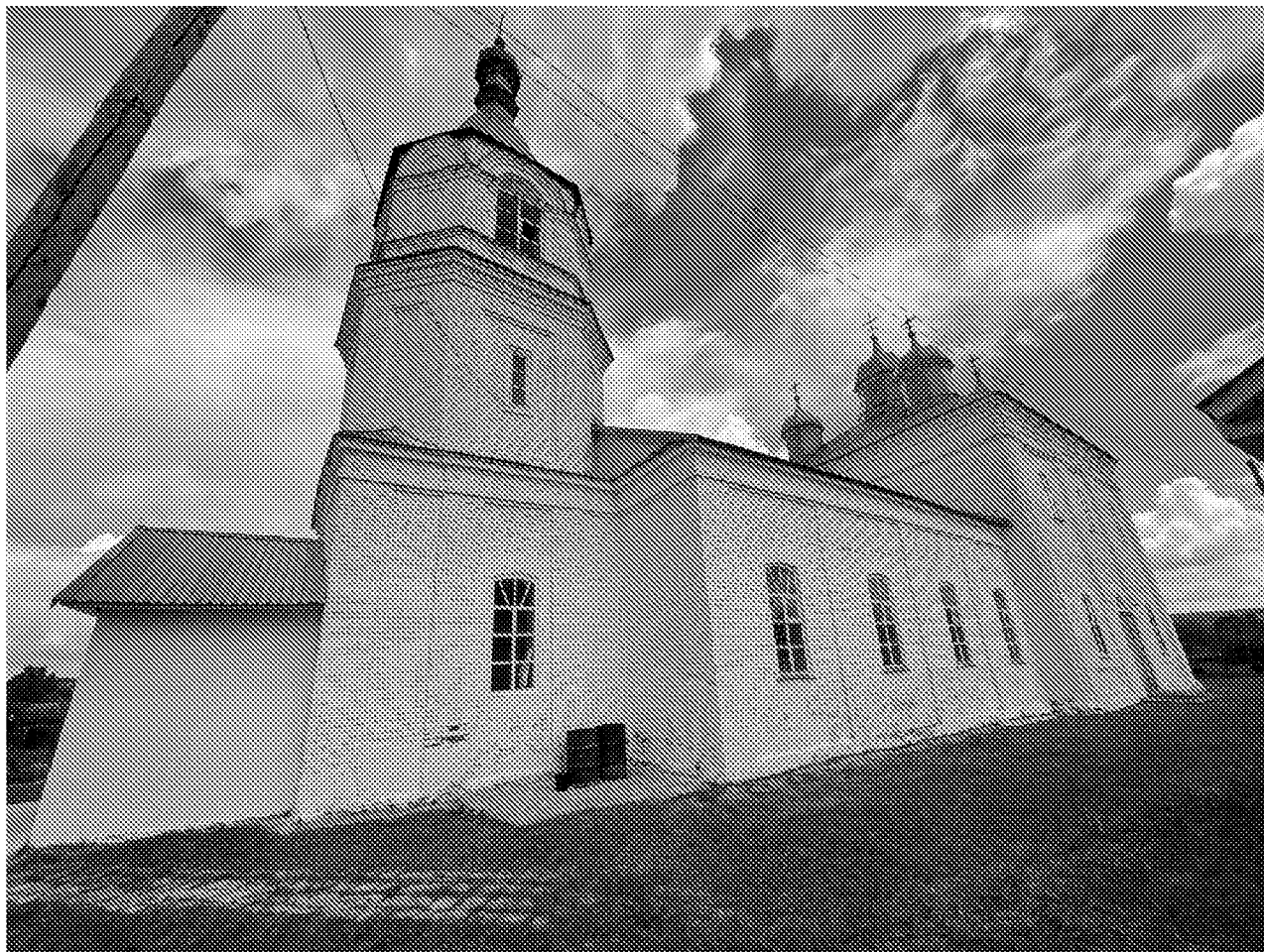
Южный фасад объекта культурного наследия