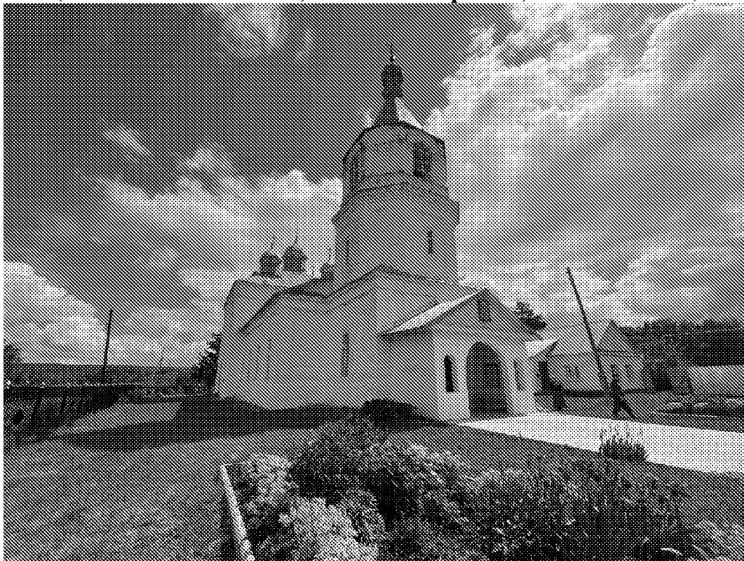
Северо-западный фасад объекта культурного наследия