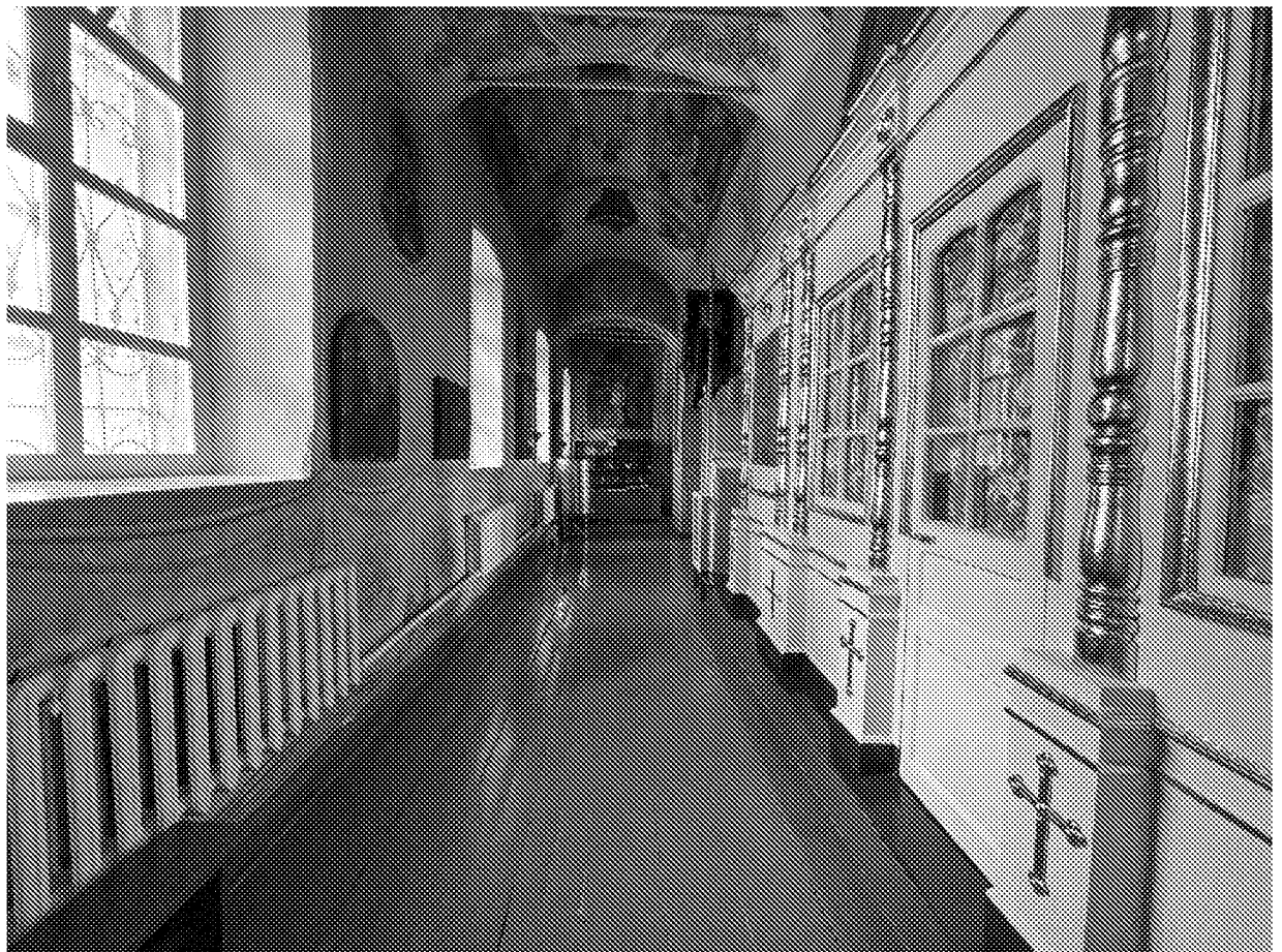
Интерьер (левый придел) объекта культурного наследия