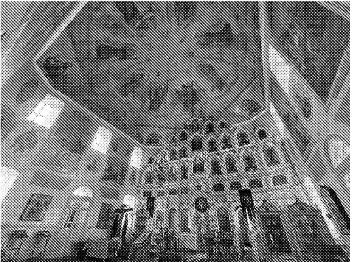
Интерьер (свод в наосе) объекта культурного наследия