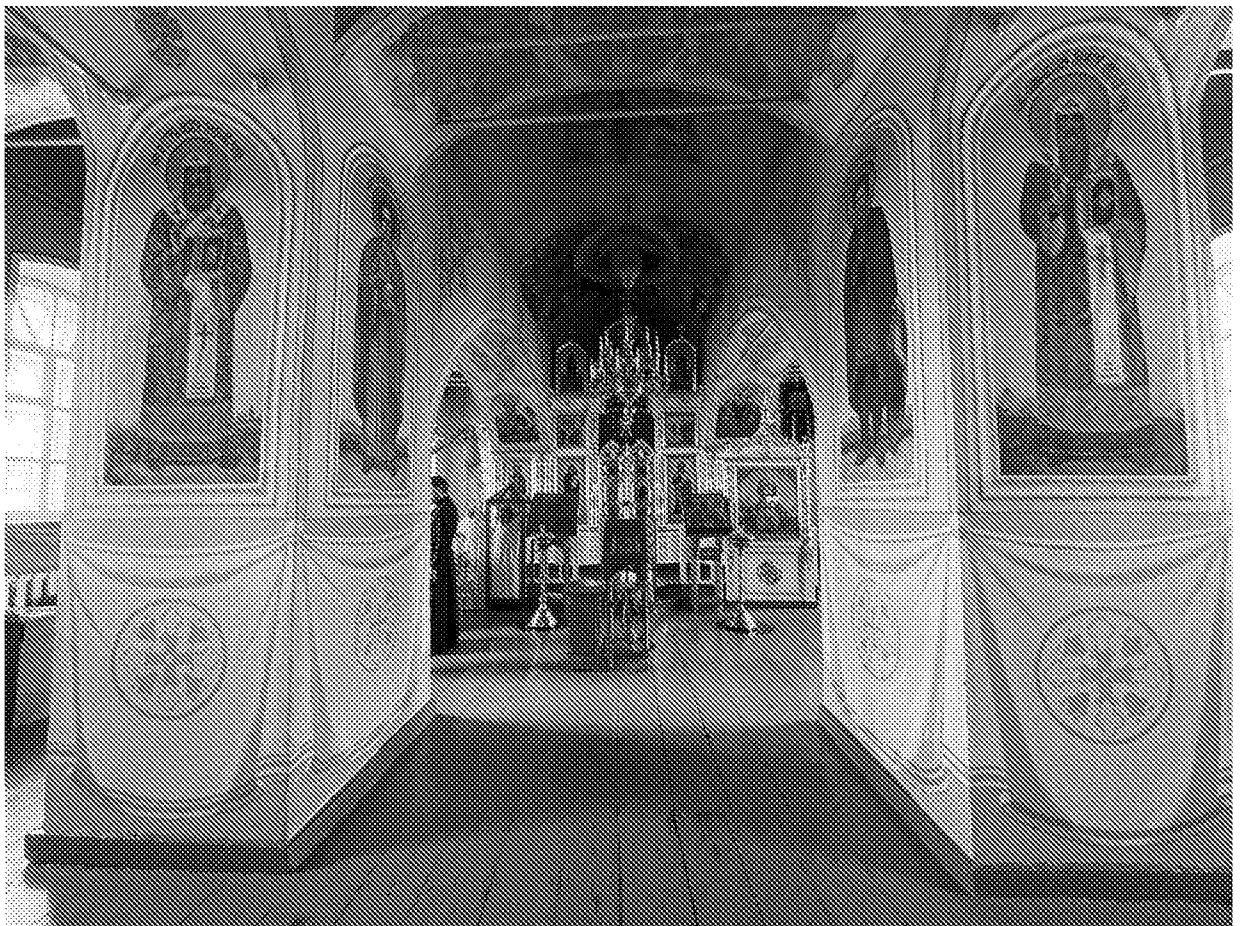
Интерьер (трапезная) объекта культурного наследия