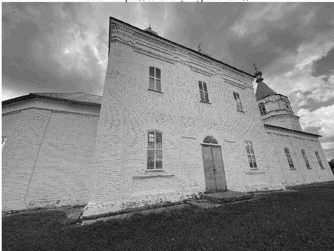
Северный фасад объекта культурного наследия