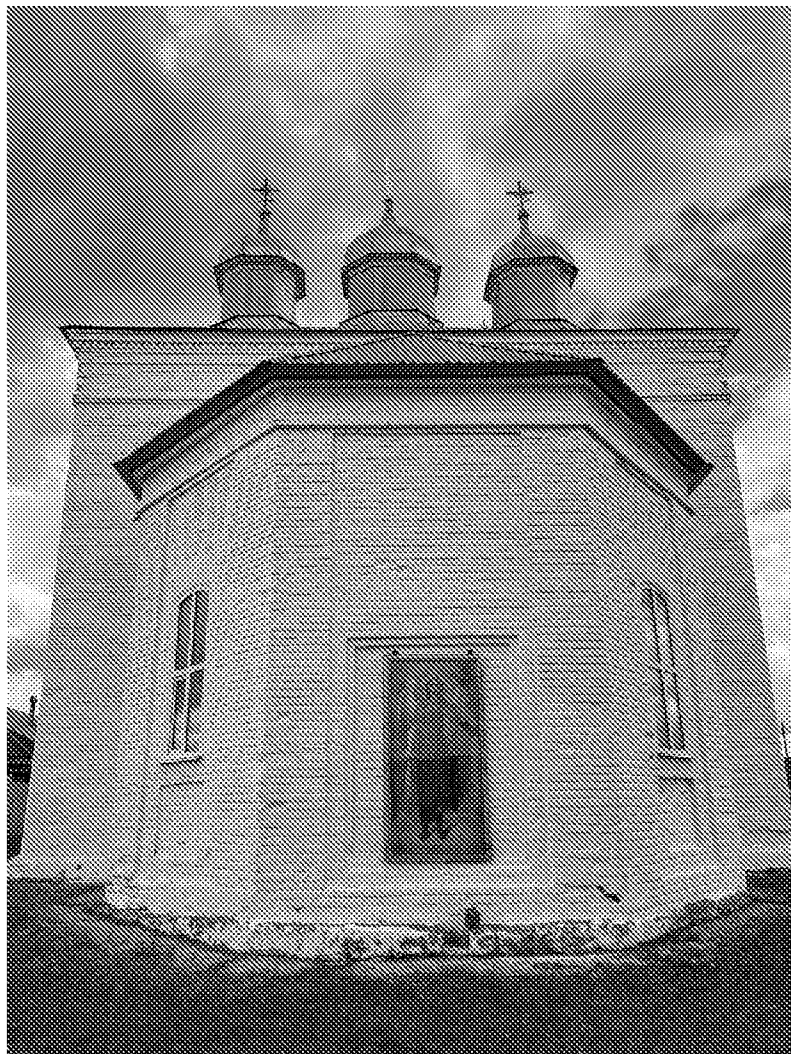
Восточный фасад объекта культурного наследия