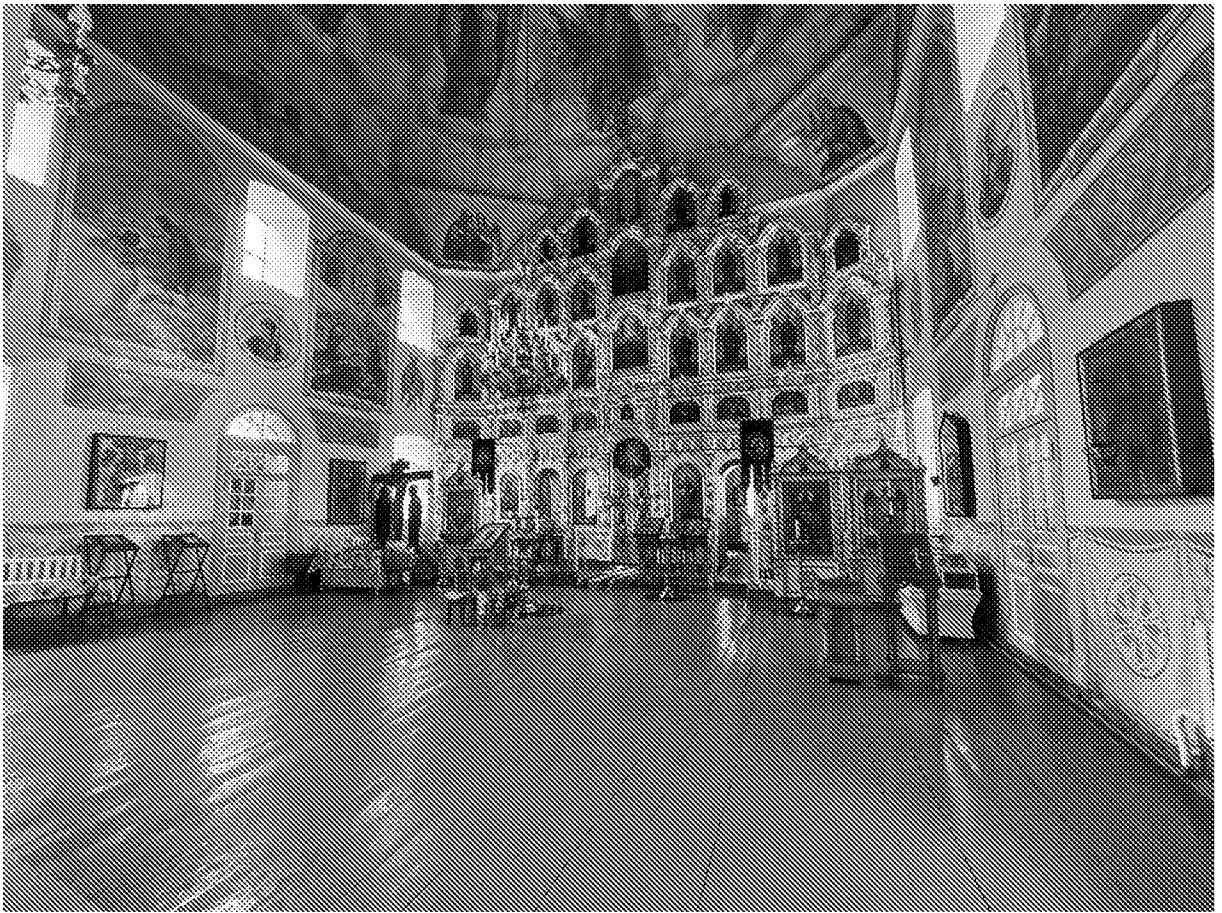
Интерьер (наос) объекта культурного наследия