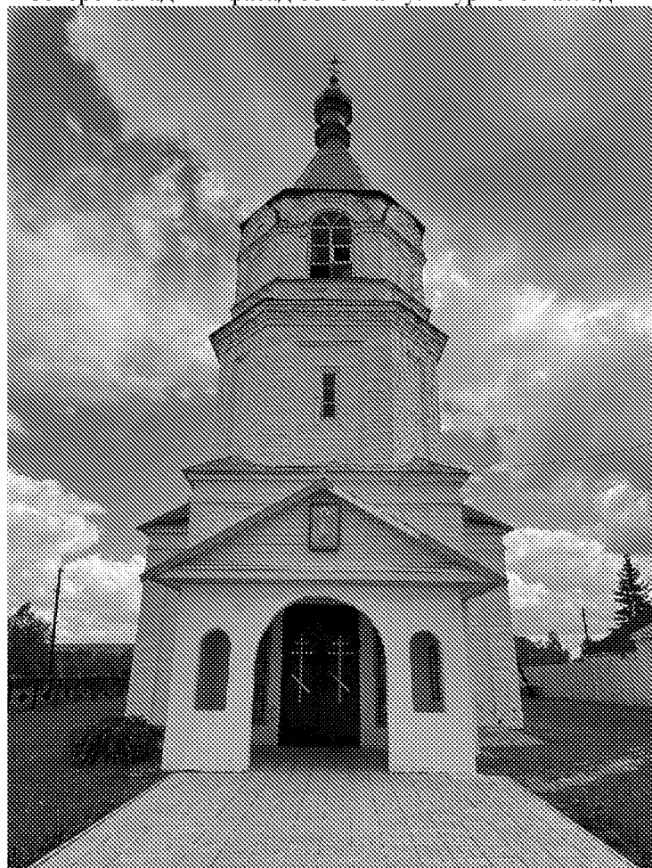
Западный фасад объекта культурного наследия