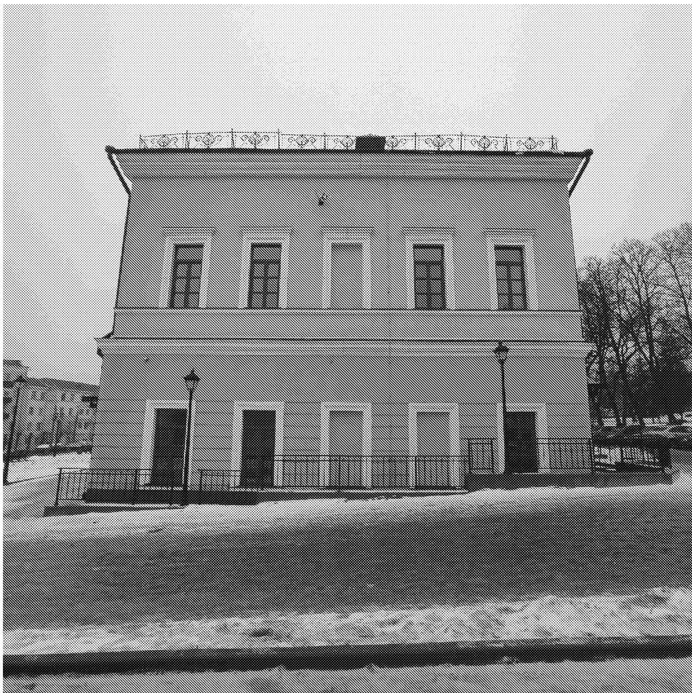
Вид на объект культурного наследия с северной стороны. Боковой фасад (23.12.2022)