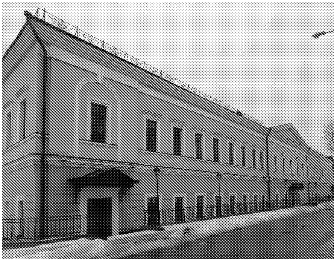
Общий вид объекта культурного наследия со стороны улицы Белинского (02.08.2021)