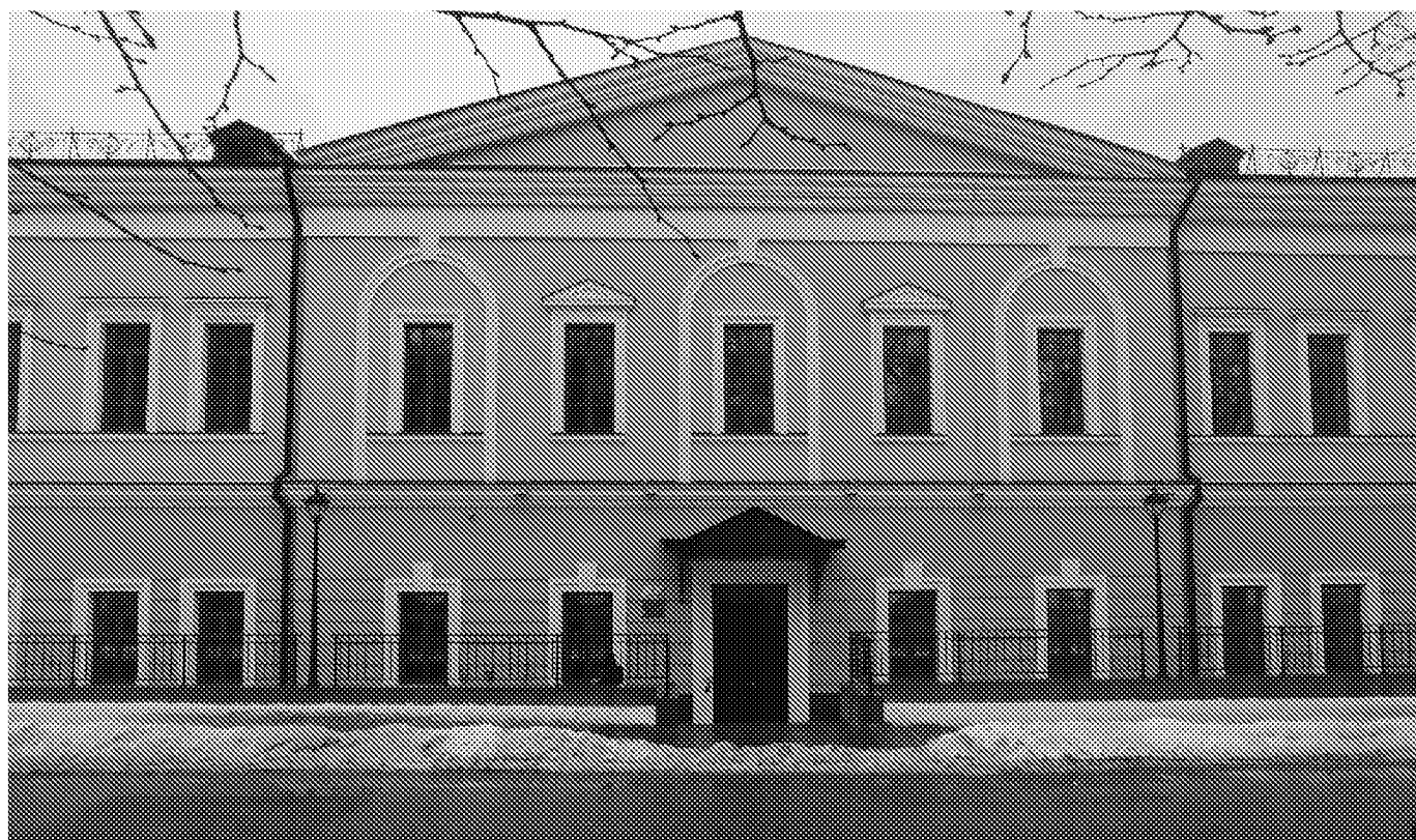
Фрагмент главного фасада объекта культурного наследия (со стороны улицы Белинского) (23.12.2022)