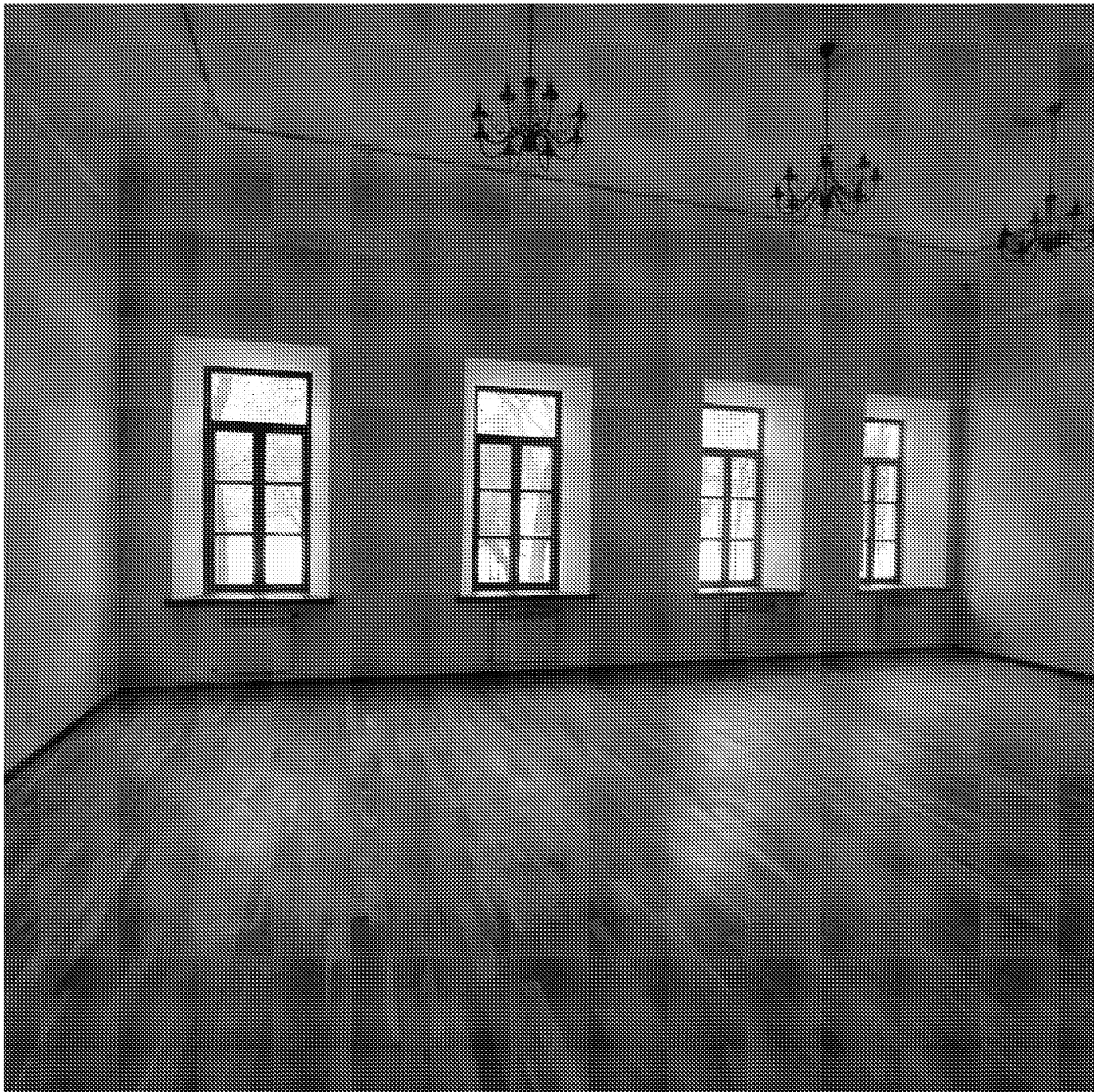
Помещение 2-ого этажа объекта культурного наследия (23.12.2022)