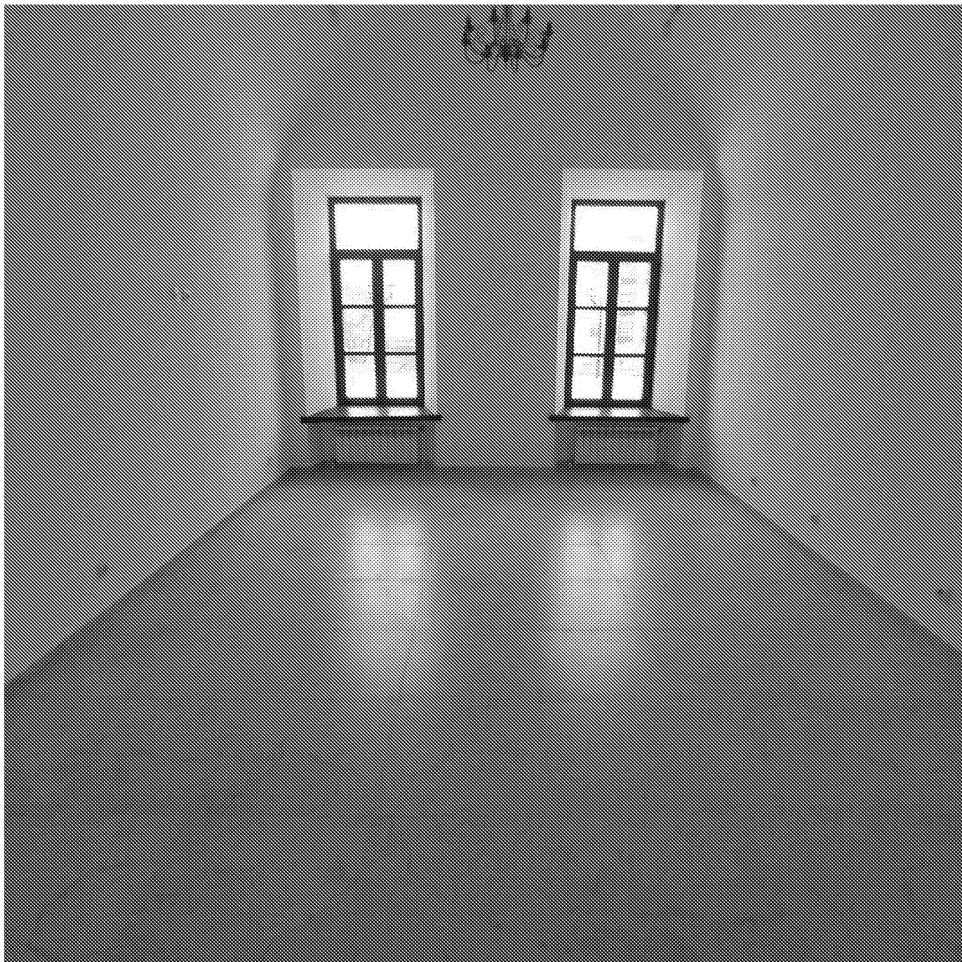
Помещение 1-ого этажа объекта культурного наследия (23.12.2022)