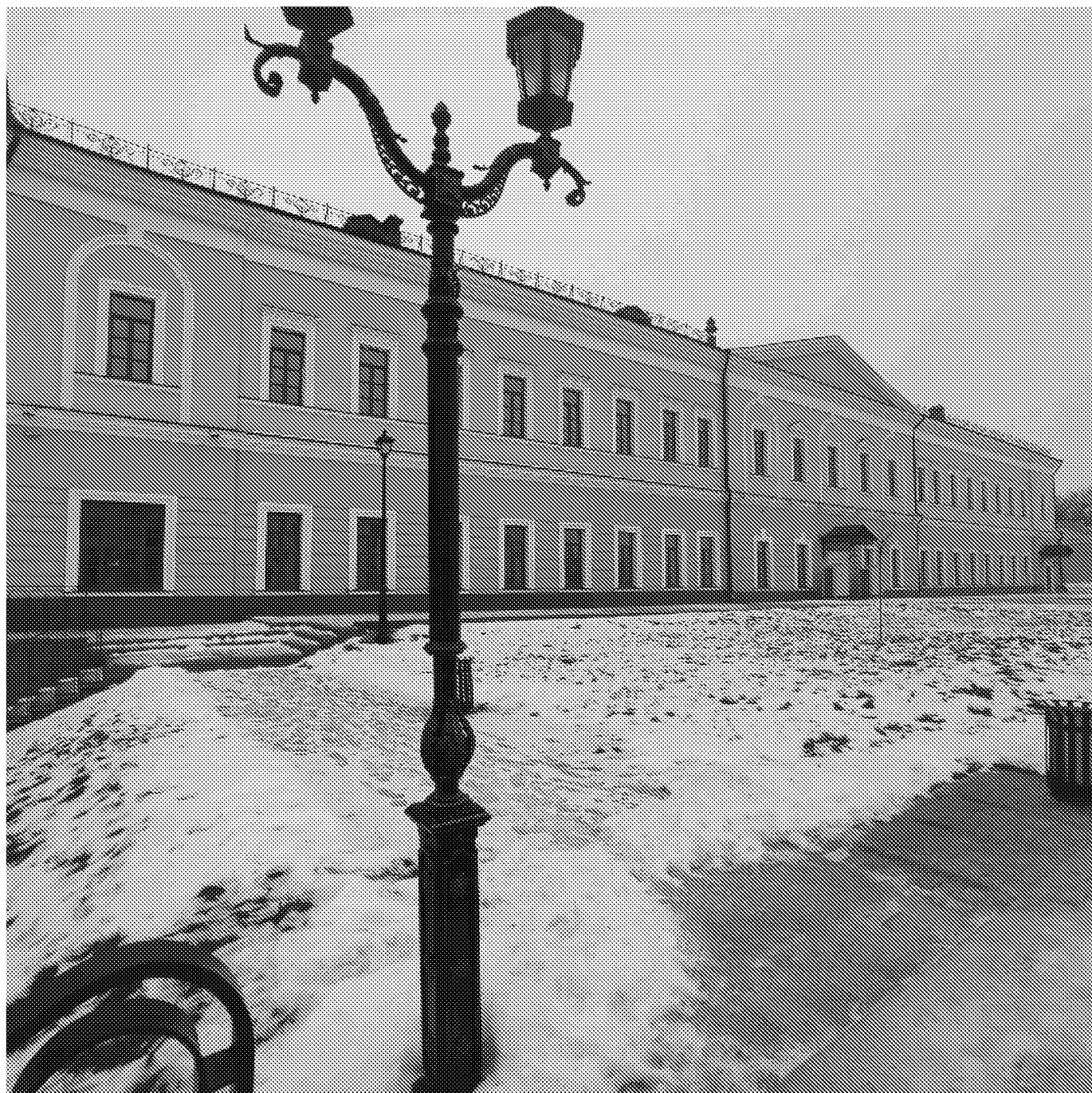
Общий вид объекта культурного наследия со стороны улицы Кирова (23.12.2022)