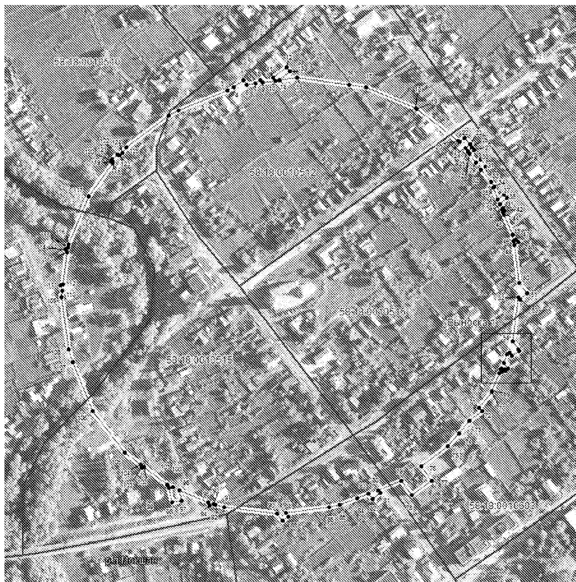
Масштаб 1:3 000