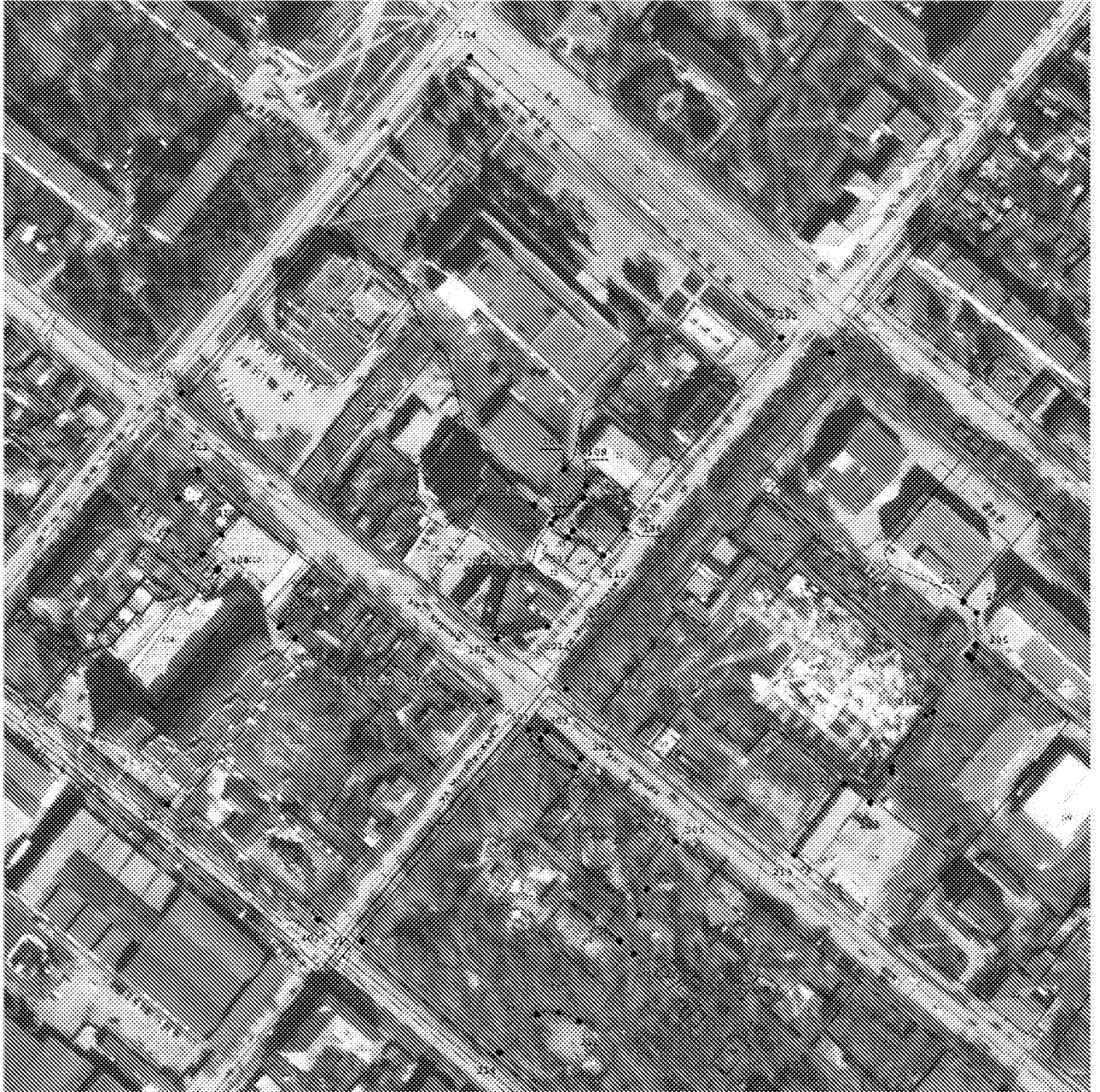
Масштаб 1:2 000