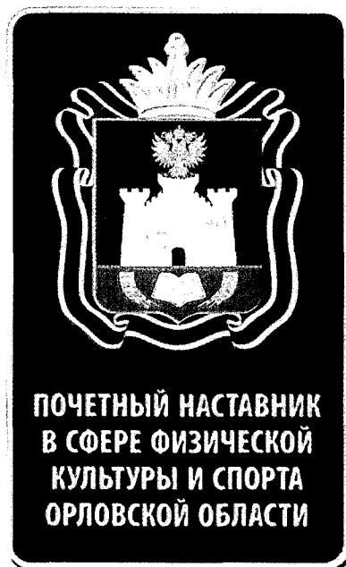
Рисунок знака отличия «Почетный наставник в сфере физической культуры и спорта Орловской области»

Рисунок знака отличия является неотъемлемой частью настоящего описания.