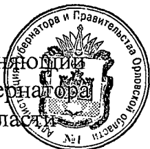
В. А. Тарасов

Временно исполняющий обязанности Губернатора Орловской области