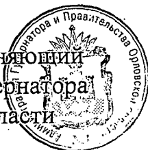
В. А. Тарасов

Временно исполняющий обязанности Губернатора Орловской области