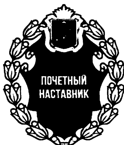
Рисунок знака отличия «Почетный наставник Орловской области»