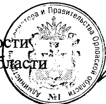
В. В. Соколов

Исполняющий обязанности Губернатора Орловской области