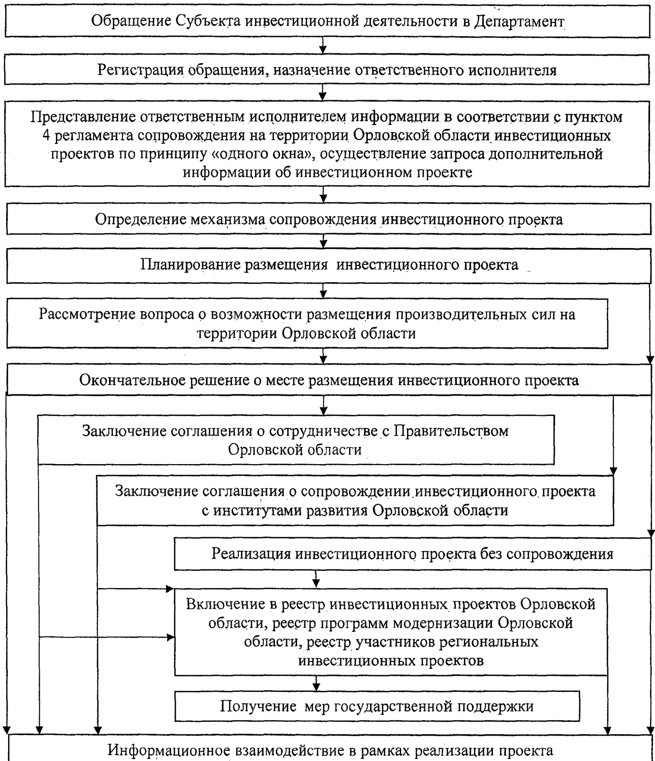
Схема сопровождения на территории Орловской области инвестиционных проектов по принципу «одного окна»

Приложение 1 к регламенту сопровождения на территории Орловской области инвестиционных проектов по принципу «одного окна»