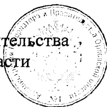
А. Е. Клычков

Председатель Правительства Орловской области