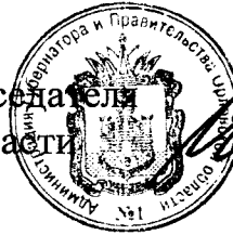
В. В. Соколов

Исполняющий обязанности Председателя Правительства Орловской области