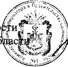
В. В. Соколов

Исполняющий обязанности Губернатора Орловской области