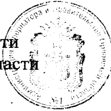
Н. В. Злобин

Исполняющий обязанности Губернатора Орловской области