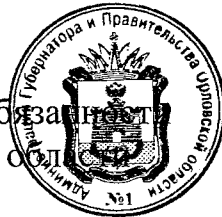
А. Е. Клычков

Временно исполняющий обязанности Губернатора Орловской области