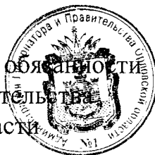
А. Е. Клычков

Временно исполняющий обязанности Председателя Правительства Орловской области