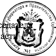
А. Ю. Бударин

Исполняющий обязанности Председателя Правительства Орловской области