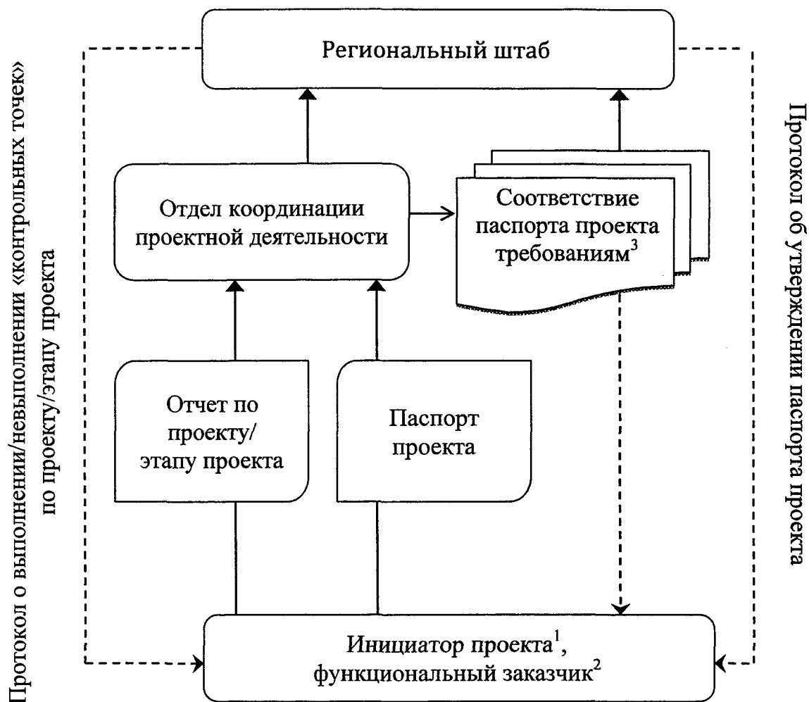
Схема взаимодействия органов исполнительной государственной власти специальной компетенции Орловской области при реализации проектной деятельности