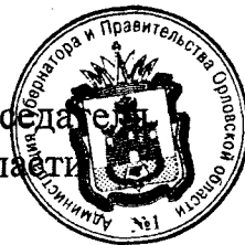
А. Ю. Бударин

Исполняющий обязанности Председателя Правительства Орловской области