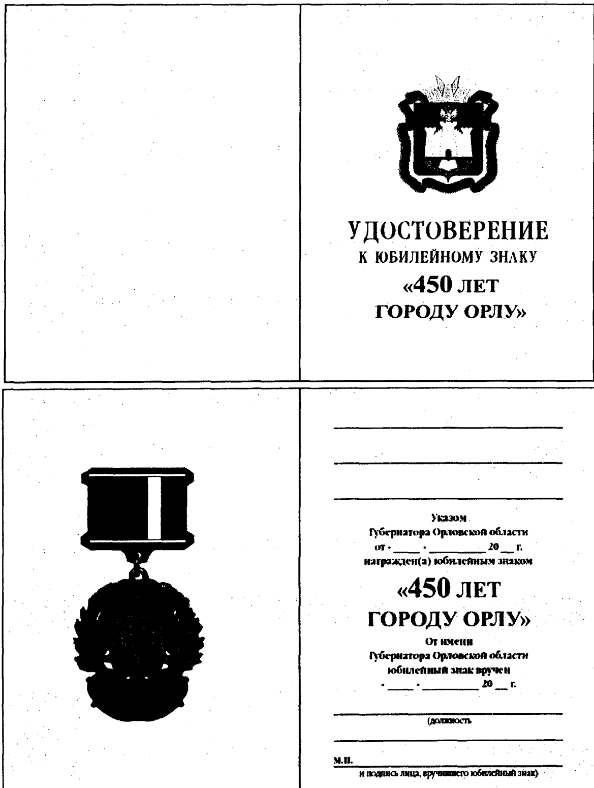
Рисунок бланка удостоверения к юбилейному знаку «450 лет городу Орлу»