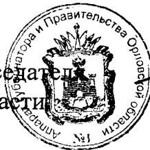
А. Ю. Бударин

Исполняющий обязанности Председателя Правительства Орловской области