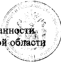
А. Ю. Бударин

Исполняющий обязанности Губернатора Орловской области