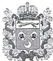
Рисунок Почетной грамоты министерства строительства, жилищно-коммунального, дорожного хозяйства и транспорта Оренбургской области