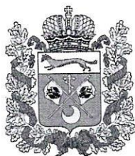
Рисунок благодарственного письма вице-губернатора – заместителя председателя Правительства – министра строительства, жилищно-коммунального, дорожного хозяйства и транспорта Оренбургской области