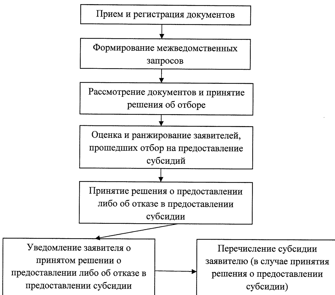
БЛОК-СХЕМА последовательности действий при предоставлении государственной услуги