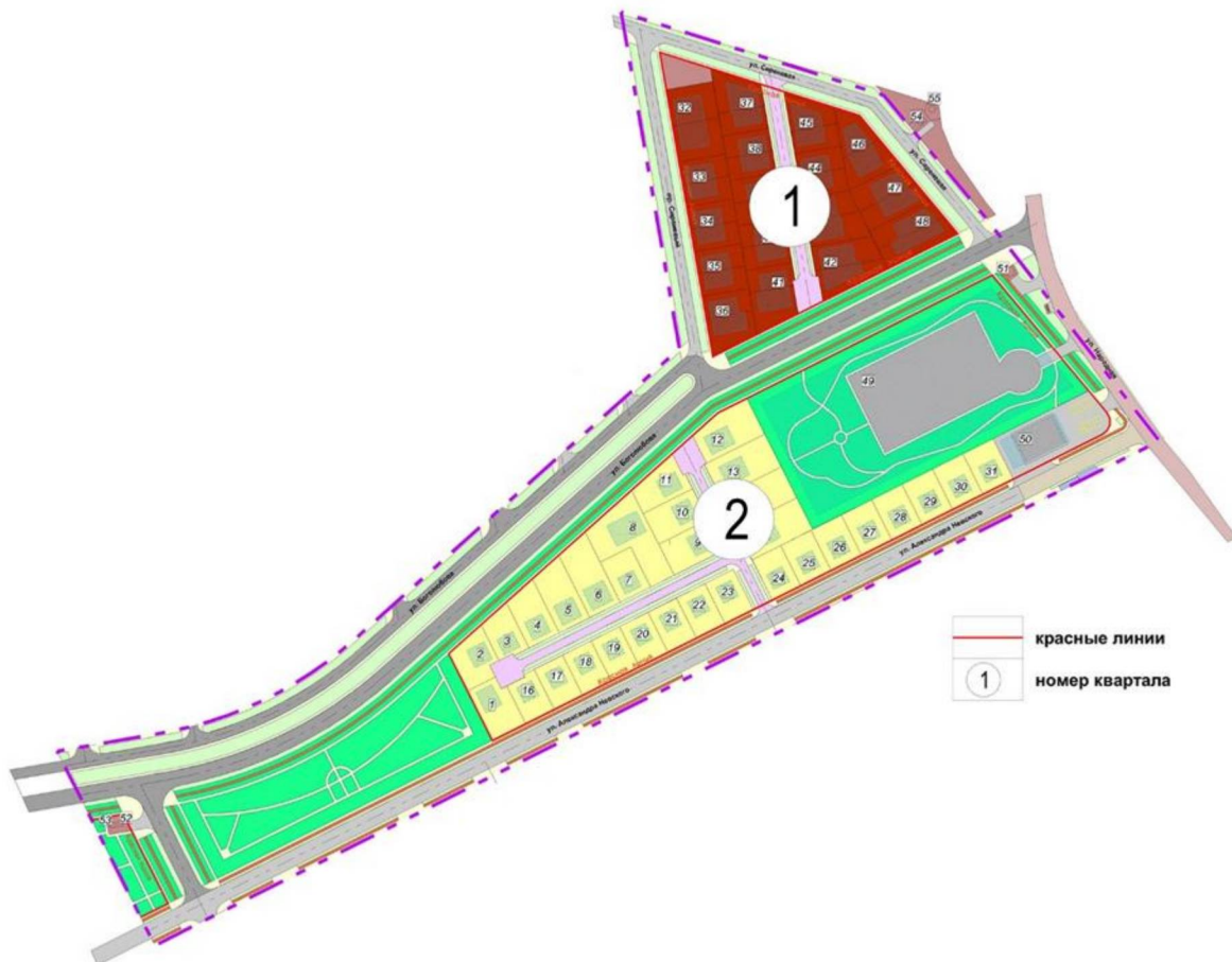
Схема расчетных кварталов