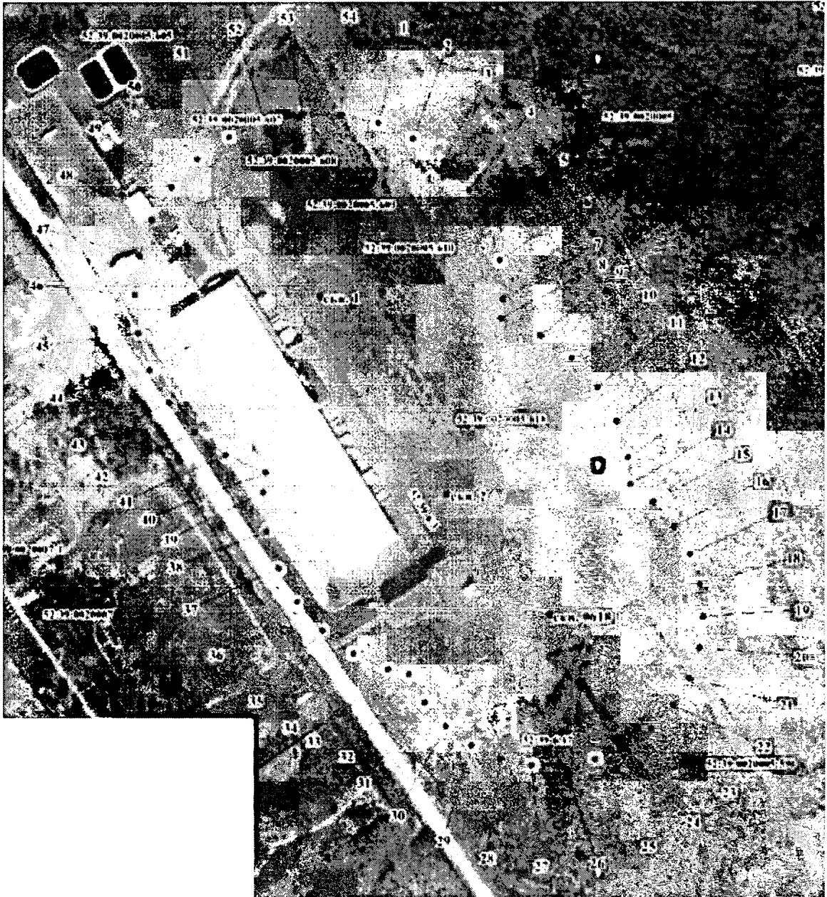
Координаты характерных точек границы второго пояса ЗСО водозаборного участка