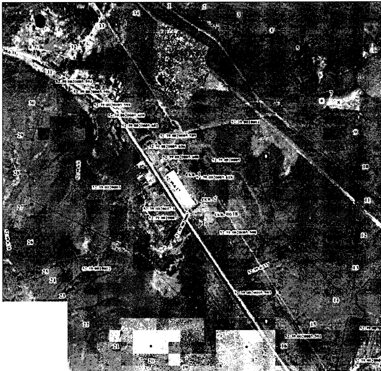
Координаты характерных точек границы третьего пояса ЗСО водозаборного участка